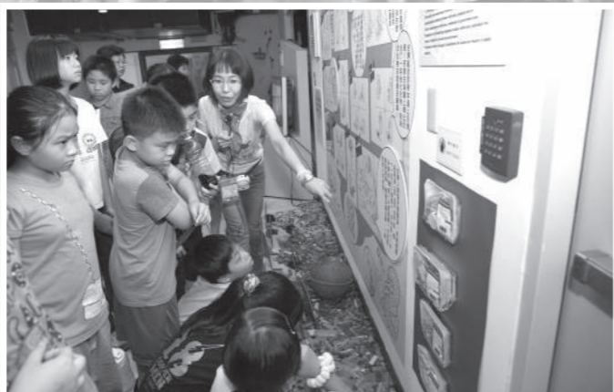
▲小朋友！看看小阿信今天午餐是什麼？海洋特展的解說志工在海洋汙染展區介紹「小信天翁的便當日記」，地面為 2012 年全台淨灘收集 6000 多個打火機佈置成的彩虹。

許多學校師生受到「環境教育法」的驅動，企業夥伴則是日漸重視「企業社會責任」，淨灘忽然熱門起來。不管動機為何，對協會來說都是非常難得之機會，因為地球需要的不只是一雙雙撿起垃圾的手，而是一個個願意友善環境的心。我們針對不同年齡層與族群，規劃了多套關於海洋廢棄物教案，讓每位民眾在彎腰淨灘前，都能吸收不同程度的環境教育。企業員工可選擇 2 小時的「海洋塑化記」紀錄片導讀欣賞，或是 1.5 小時的「塑誰殺了信天翁」課程；50 分鐘的「塑膠寄居蟹」與 DIY 活動則是為國小學童設計；而海邊現場的破冰小遊戲，除了慣用多年的恐怖海鳥胃，今年也開發出全新的教案「塑要等多久？」，只要 10 分鐘，志工們就能讓民眾對海洋危機有感，並化感動為行動。