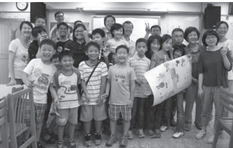
▲ 荒野親子團節能綠活圖—認真活潑北四團

每一次的相聚都是一個特殊的緣份：成福國小校長和師長，帶領孩子們參與濕地營造及節能減碳的生活行動；鄧公國小在各年級教室共裝設18個電表做為示範，師生節能總動員更編寫節能歌、跳節能舞；碧湖國小能源教育團隊的研習課程，讓我們感受到散播的種子很快就要發芽；從新竹到台北的共學團媽媽們的用心安排，讓我們看到家庭教育的希望；社區老、中、青、幼等成員的參與，讓我們真正走入家庭，更讓民眾感覺到氣候變遷、節能減碳好像不再如想像中那麼嚴肅生硬，而我們共同對環境的愛和約定，將成為彼此生命中美好的一片風景。🌱