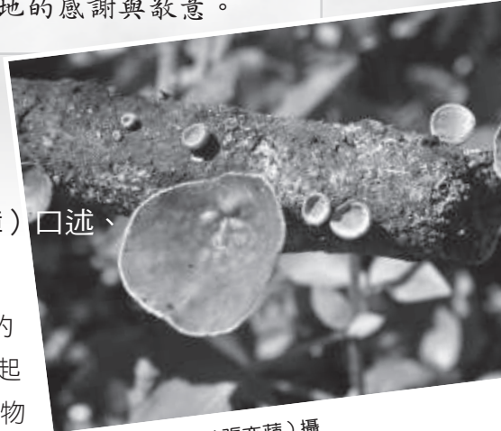
▲ 毛木耳／蘋果（張亦蘋）攝

不同的生物有不同的特性和生存模式，就如同人類社會一樣，這樣互相扣連的多樣性共同構成了環境的平衡，解說的目的，也是想告訴大家自然背後運作的道理。例如有山就有水，有水就有魚。森林可以留下水，而枯枝落葉落到水中可以讓藻類生長，魚兒就有食物。更重要的是，想傳達給大眾知曉自然保育的觀念，應是合理的運用自然資源，就像我們不能永遠都進口別人的木材，必須思考如何在自己的土地和萬物共生共存！🌿