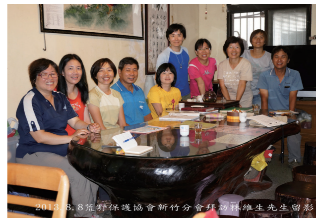
▲ 每回訪談結束後都會將合照相片洗出送給受訪者留念

縱是水圳生命幾經轉折，還好，還有磚造隧道可尋，還有圖冊可讀，還有山林可退，人在草木間，草木如畫，一種遺失的美好仍在；水圳家族，未曾停歇，沒有平淡，眼下盡是繁華似花。