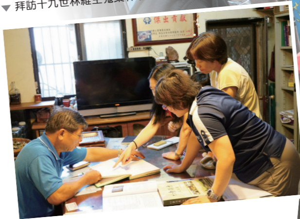
▼ 拜訪十九世林維生蒐集林家歷史

集資將土地所有權購回；談到家族的曾經輝煌，慨然道起這甜美的果實並未是人人都能擁有。