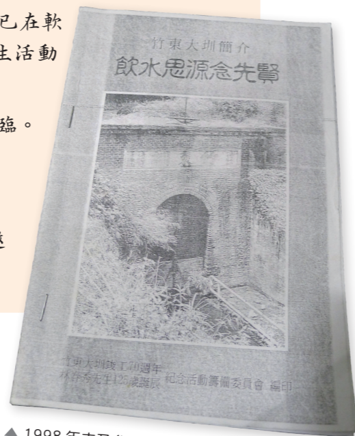
▲ 1998 年末及參與的水路大隊卻在 2008 年接續深化的傳承至今