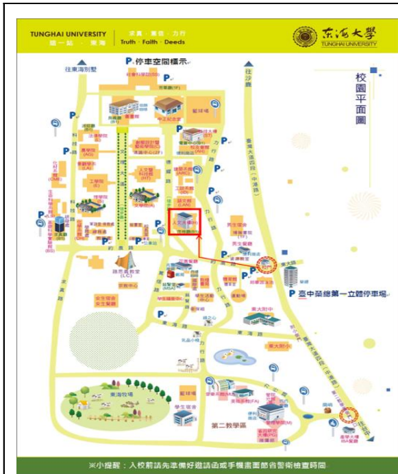
*地圖 1 會場—東海大學 人文大樓一樓 校園地圖資訊—顯示地圖