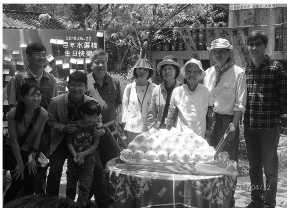
▲ 壽桃祝福百歲水簾生日快樂。

新竹分會大坪組於峨眉六寮定點觀察，透過定期的觀察，紀錄環境與生態，並舉辦趴趴走活動，藉由分享六寮之美，帶領民眾親近自然，並透過解說活動，推廣環境教育，引導大家關懷周遭環境，共同愛護地球。