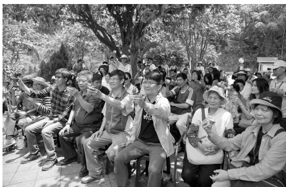
▲ 百人共飲東方美人茶，舉杯慶生。

日中午時，百人歡聚遊客中心廣場，舉杯共飲東方美人茶，祝福百年古橋生日快樂。大人書寫對石橋的祝壽詞語，小孩提筆畫圖向古橋拜壽。滿滿一整籃充滿仙氣的壽桃，百年豬油餅、月光餅、粢粑、甜水粿、菜包……等等美食，用樸實的原料，傳遞客家人珍惜資源，保存食材的智慧。如同拓墾的先民在資源不足，建材難以取得的當時，利用天然的自然原料，建造出堅固的糯米橋，前人的智慧蘊藏於百年石橋。享用著滿溢客家人情味的祝壽糕點，濃郁的香氣、人氣和仙氣，繚繞整個壽宴。