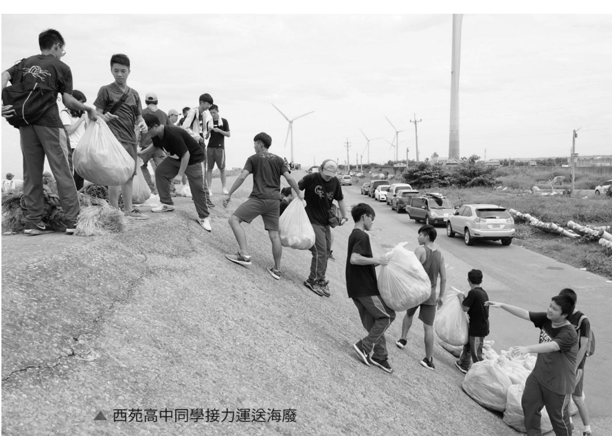
▲ 西苑高中同學接力運送海廢