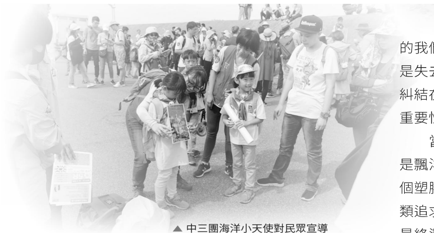
▲ 中三團海洋小天使對民眾宣導

灘行前，所付出的辛苦和努力，這段過程才是小鷹最令人激賞的地方，看到小鷹這樣的表現，我不禁想要問一句，我們大人呢？