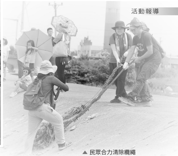
▲ 民眾合力清除纜繩