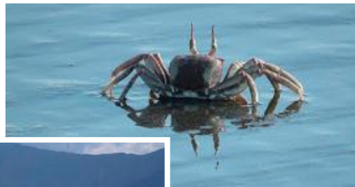
▲ 沙灘處處可見的沙蟹