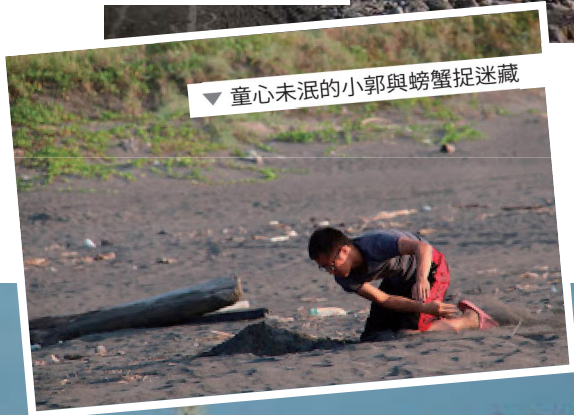
▼ 童心未泯的小郭與螃蟹捉迷藏