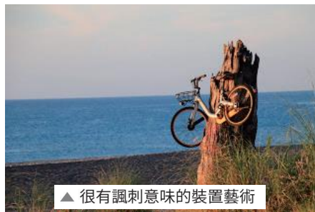
▲ 很有諷刺意味的裝置藝術

這天是海岸行腳最大關卡，因路線長需折返、沿途無補給，加上機器一早罷工延後出發；因此即便夥伴都是健腳，走完這趟已接近中午，炙熱的氣候個個大喊吃不消，非得連嗑兩碗冰才能消暑。