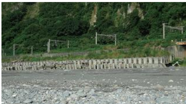
▲ 岸邊散佈著蘇花改善工程材料

此段為原規劃路線的最後一段，許多夥伴把握最後機會參與，然而此段海岸線正進行邊坡護岸等工程，因此安排開路先鋒前導角色，也順利在八點前完成海岸記錄的任務。