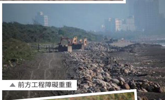
▲ 前方工程障礙重重