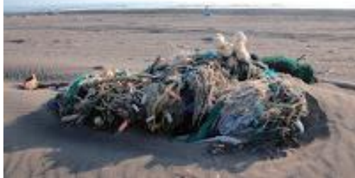
▼ 大海也將漁民廢棄漁具還給人類

相較於前兩天輕鬆漫步 ~ 今天是第一場硬戰，從距離拉長、起點施工、夥伴身體不適、時間壓力等，因此緊急應變調整人力及終點變更，也算是有驚無險完成當天任務，而今日亮點是多了萌軍啦啦隊，帶著補給品慰勞辛苦的夥伴。