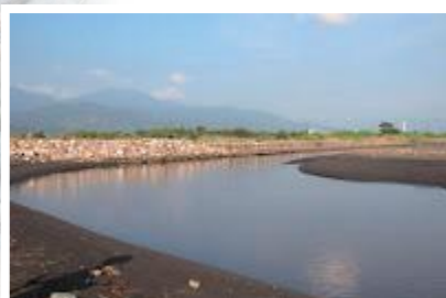
▲ 剛人工整治完成的新城溪出海口