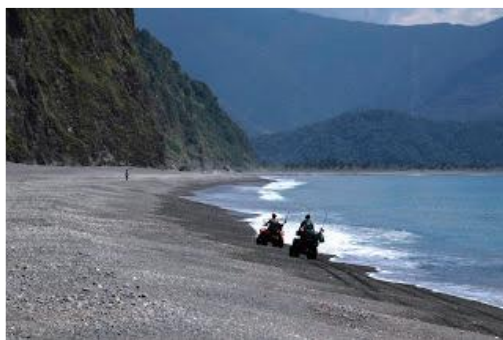
◀ 海灘車及四輪驅動車載客旅遊服務