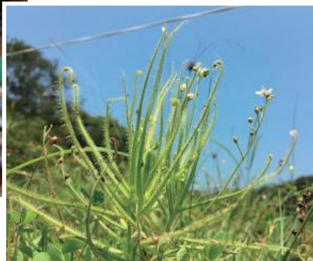
▲ 長大了的長葉茅膏菜