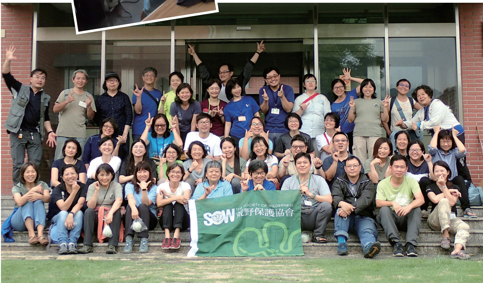
▲ 大合照 - 2019 荒野志工聯合訓