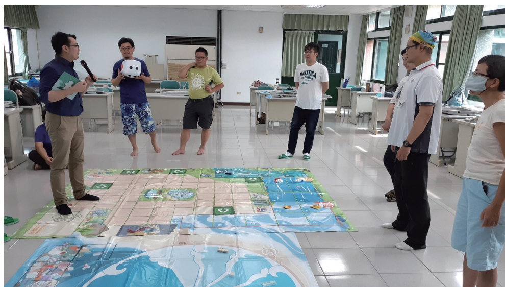
▲ 海洋危機放大版桌遊

→桌上型規則較多困難度比較高。兩種玩法玩下來不同感受。地遊型，我們真人與眼前實體垃圾在一起，玩起來「垃圾感」很重；桌遊型，因為困難度較高，遊戲結束時很多垃圾無法清除，「危機感」超重的讓人帶著遺憾離桌。