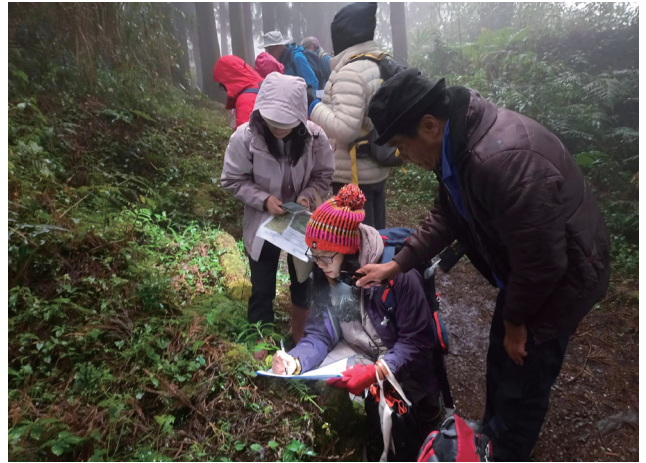
▲ 黑森林內進行蕨類觀察

時隔多年再辦理解說員訓練，光是達成共識及籌備就持續了幾個月，讓隊輔們多了一些準備時間。經歷了幾次的籌備會議，確認大家的參與是出自個人意願、了解每位夥伴對於解說的概念、找出過往解說員訓練資料，並研究其他分會目前的訓練課程及資源，討論出這一次 13 解的課程內容，最後，就是準備讓課程上架招生。