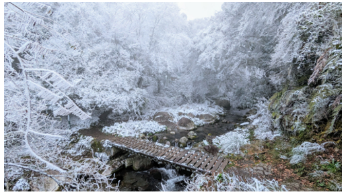
▲台北分會 - 思源啞口

能夠走過 30 年這麼長的歲月，相信荒野保護協會在生態保育與環境教育領域的深厚根基，我想包括有幾項因素：明確的使命與願景以「推動自然保育、環境教育，促進人與自然的和諧共處」為核心使命；長期耕耘環境教育、志工體系的穩健發展、政策與社會環境的助力、社區參與與在地連結、多元的資源與募款策略、環保議題的倡議與行動力、與國際接軌的環保理念等等。在全球環境挑戰加劇的當下，荒野保護協會的努力與堅持對台灣社會產生了深遠的正面影響引領未來的環境保育行動。