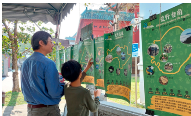
▲ 《諸神的黃昏》場外民眾察看

從蒐集的資訊，我看見的不只是自然之美，更是人與自然共處的感動。每個場域的保護與修復，背後都有荒野志工的默默奉獻。這樣的步伐，讓我深深體悟到守護自然的重要性。