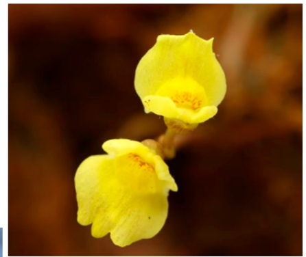
▶宜蘭分會 - 雙連埤 黃花狸藻