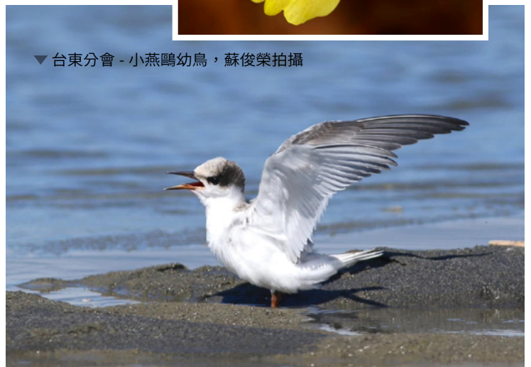
▼台東分會 - 小燕鷗幼鳥