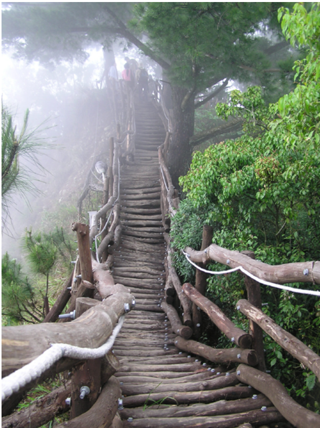
▲台中分會 - 大坑

這 30 年的荒野足跡，是一部不斷探索與成長的自然保育史詩。從無數的保育場域、動植物到社區的參與，荒野保護協會讓人們看到了守護自然的無限可能。我很慶幸能成為這段旅程的一部分及荒野人，來荒野一年多，參與了桃園氣候變遷和台北的綠色生活地圖講師培訓，正逢協會 30 周年，以 169 個綠活圖 icon 為底的海報向荒野人致敬。🌱