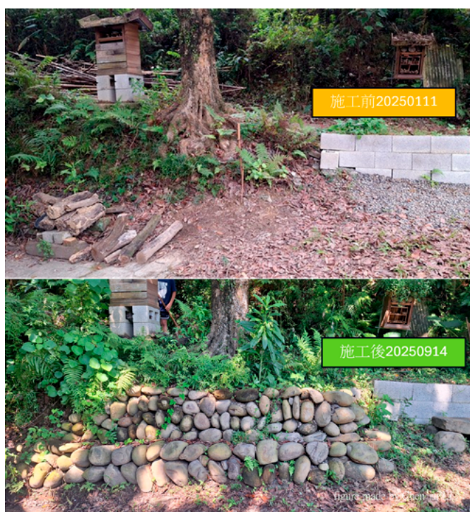
▲ 砌石護坡施工前後

砌石護坡是一項極度耗體力的工法，雖然事前畫了圖，但棟哥額外加碼：駁坎要能「當椅子」！結果施工過程三進三出地調整位置，大家邊笑著抱怨，邊把工程完成。最終完成的護坡不是完美，但卻是一起努力的最好成果。