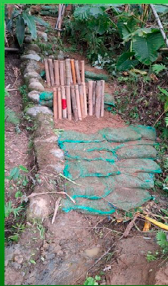
▲ 荒野桃園分會第一期手作步道學員期末施作