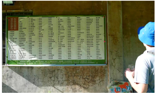
▲ 地主風雲榜 你看過一快地的持有人這麼多嗎？