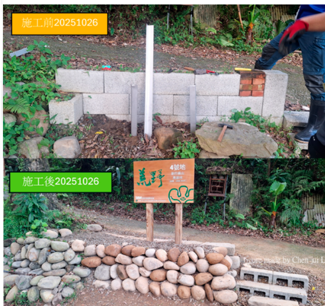
▲ 荒野保護協會 4 號地立牌施作前後