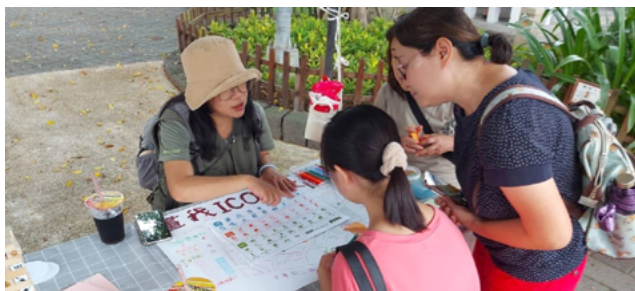
▲ 荒野台北永昌里 - 畫我 icon 中秋節擺攤推廣

在綠活圖的視角下，我們實行的是 社區資產盤點 。我們尋找里內的綠地、古樹、友善店家，將焦點放在「我們擁有的美」，不只是「我們缺乏的苦」。這種正向的連結，讓荒野台北與永昌里的線上綠活圖成為了一個充滿生命力的永續資料庫。