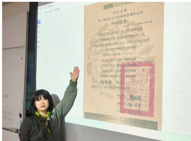
▲ 綠活圖台北第 10 期推廣講師頒發結業證書 - 宇宙

最具挑戰性也最有成就感的項目之一，便是和社區一起深度共創「荒野台北與永昌里」的線上綠活圖。