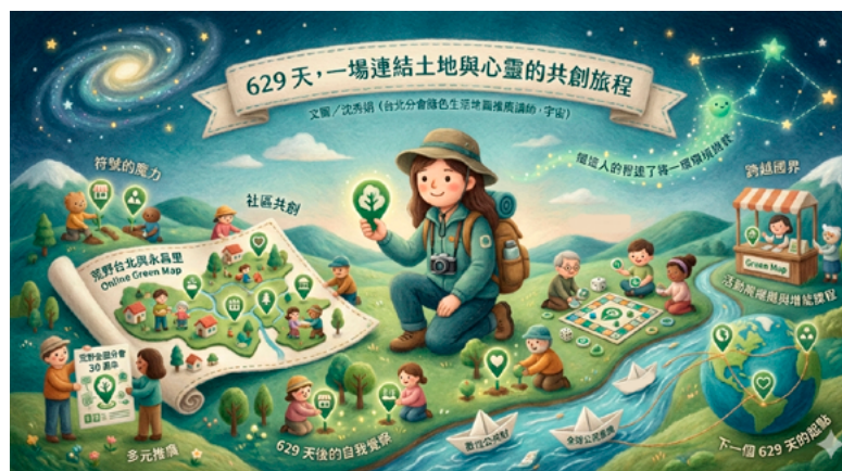
▲ 宇宙 629 天的綠活圖 ai 創作