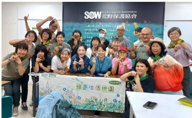
▲ 綠活圖台北第 10 期推廣講師培訓課