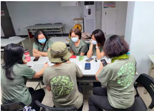
▲ 兒教志工參與實境解謎遊戲設計