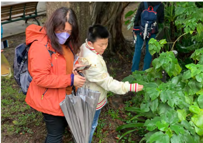
▲親子一起專注解謎

青年公園第二套實境解謎遊戲 「荒野奇寶」——遺世的飛天英雄， 歡迎上網申請「實境解謎道具包」