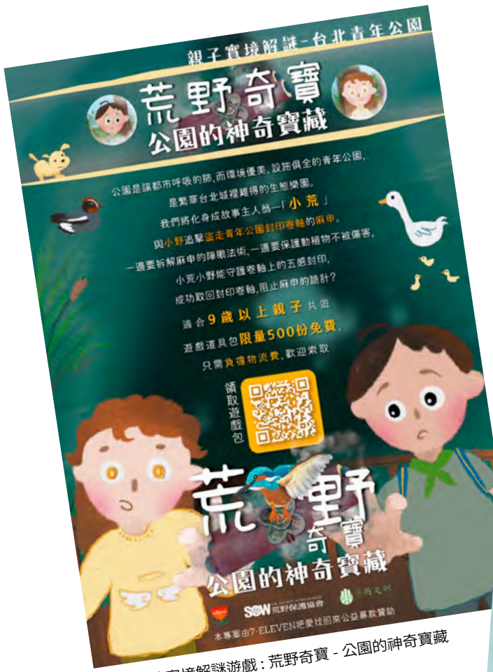
▲第一款實境解謎遊戲：荒野奇寶 - 公園的神奇寶藏