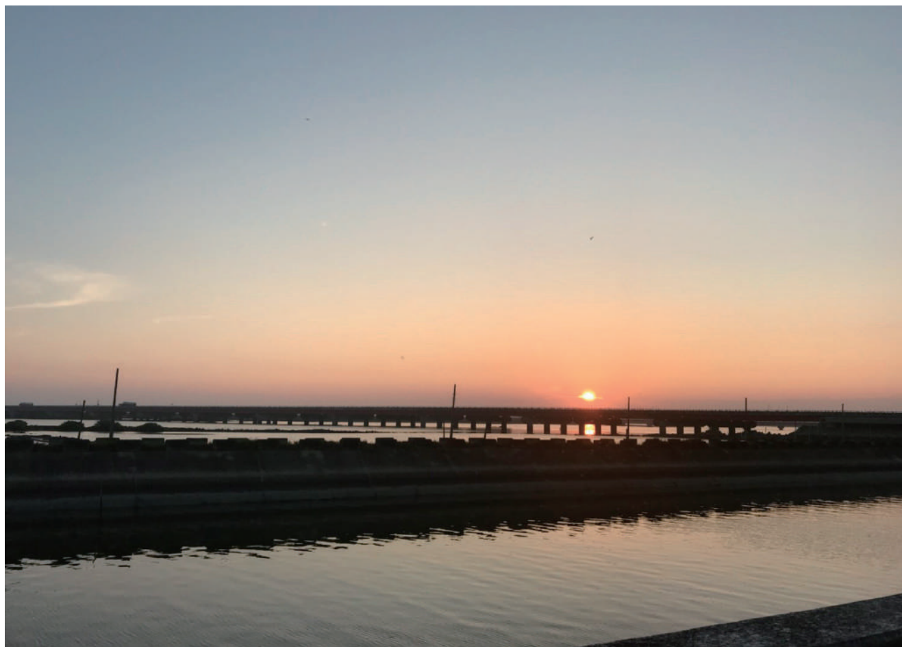
▲ 純淨的日出美景，你知道這是臺灣西岸的風光嗎？

無論是山、海或是垃圾污染的陰影始終存在。荒野的行腳活動，除了將臺灣之美記錄下來，同時也期望讓大眾理解環境的得來不易及垃圾危機等問題。只要每個人都能在日常生活中，減少非必要的一次性垃圾，就是對臺灣這塊土地最直接的支持與愛護。🌱