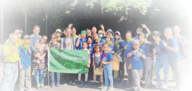
▲ 2019 十八彎秋季推廣 - 夥伴大合照

PS 去還願已經是夢後一周的事了，這咬咬夢倒是有神有準，買了金沙巧克力後謝土地公，謝謝土地公保佑，感恩啊。