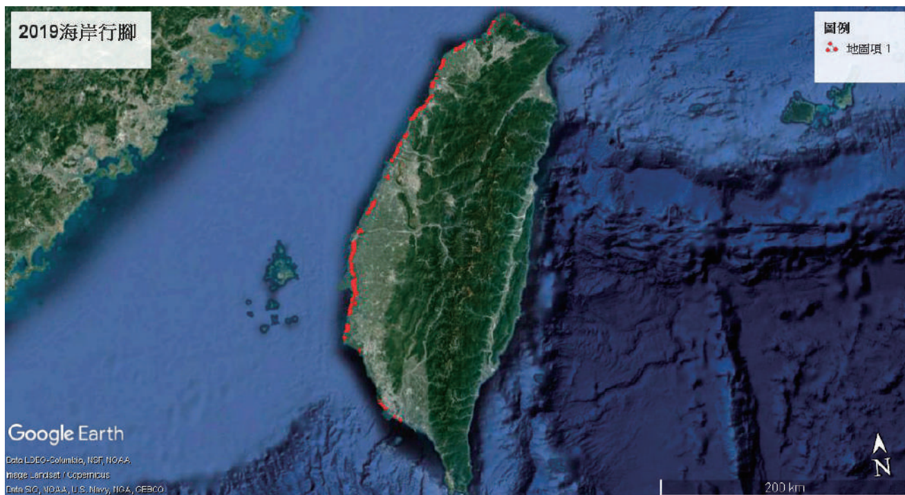
▲ 2019 年的海岸行腳路線示意圖

海 岸與山林，對於絕大多數的都市人而言，並不是一個需要經常涉足的地方。即便造訪，也不見得會留意到生態的細微之處。你想知道，海岸上或草叢間存在著什麼事物嗎？