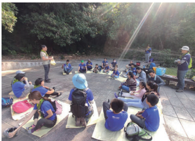
▲ 2019 十八彎秋季推廣 - 貓頭鷹廣場開場