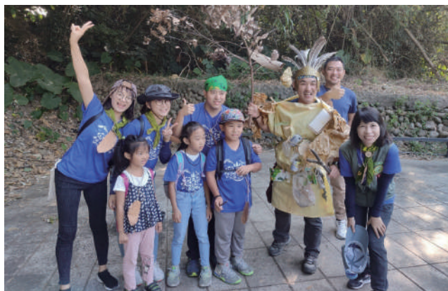
▲ 2019 十八彎秋季推廣 - 森林仿生獸 1

活動前二天的晚上我做了一個夢，夢到自己打著赤腳走在荒野，遭遇到一隻雨傘節，雨傘節咬著我的腳趾頭，我痛的唉唉叫，清醒後還記得腳趾被咬傷的痛。心中默念「以無所得故菩提薩埵依般若波羅蜜多故，心無罣礙無罣礙故無有