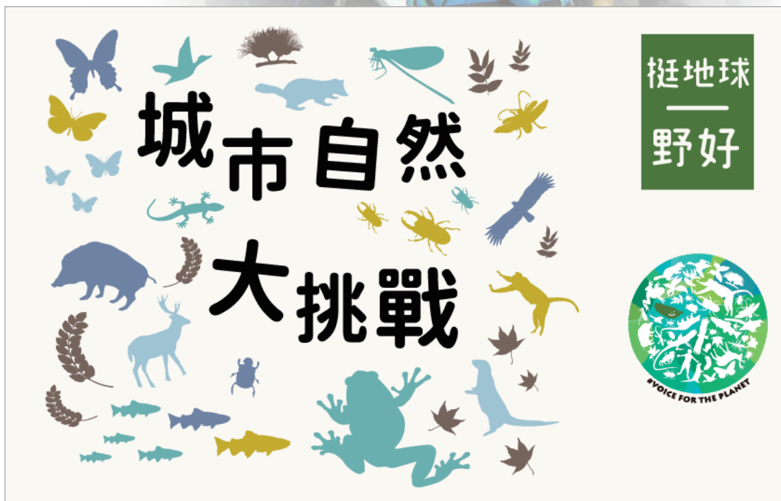
► 五十二甲濕地水生調查

良好的協助鑑定介面，可以得到相關物種辨識的研究者及愛好者的協助，除此之外，網站的行事曆功能可以讓使用者回顧之前的觀察。對於一般團隊來說，上傳 50 筆觀察後就可以自由建立調查地點及收藏專案，針對自己有興趣的地點及物種持續蒐集記錄。自從用了 iNaturalist 之後，堆積如山的物種照片終於派上用場了，可以有效的彙整及查詢，而且個人授權後，調查的資料還可同步上傳至全球生物多樣性資訊機構（Global Biodiversity Information Facility, GBIF），對世界的生物多樣性研究貢獻心力。回顧 2019 年，iNaturalist 不管是上傳筆數跟使用人數都有爆發性的成長，2019 年有超過 51 萬個使用者，上傳超過 1,350 萬筆的觀察記錄，且已經超過 17 萬的物種在平台上，顯示它越來越受到大眾的喜愛。