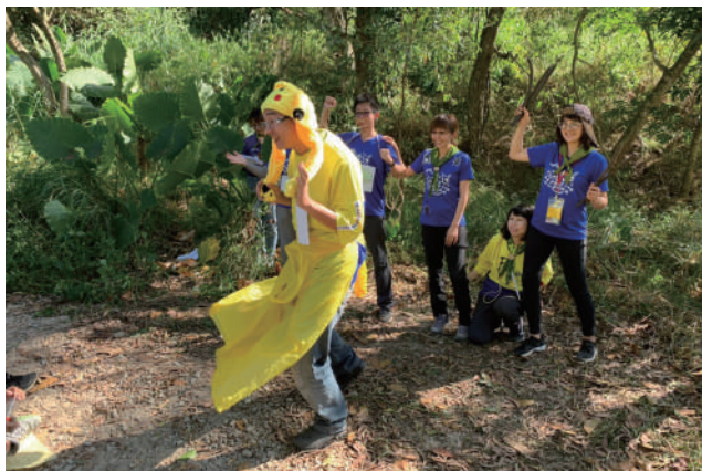
▲ 2019 十八彎秋季推廣 - 日本菟絲子親子劇場

恐怖遠離顛倒夢想究竟涅槃。」得了一個「咬咬夢」，心中一直想著要去和美跟土地公還願，活動的規劃就在心有雨傘節里礙中一邊籌備一邊忙著公事中進行著，忙到沒時間去還願……。