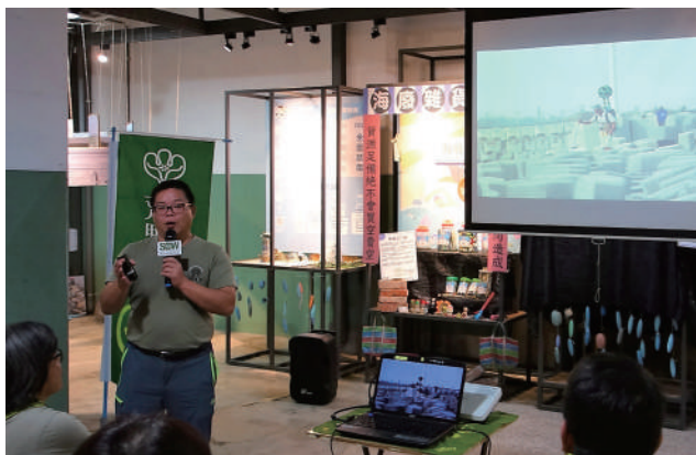
▲ 荒野志工山豬分享海岸行腳的經驗，圖麋鹿提供