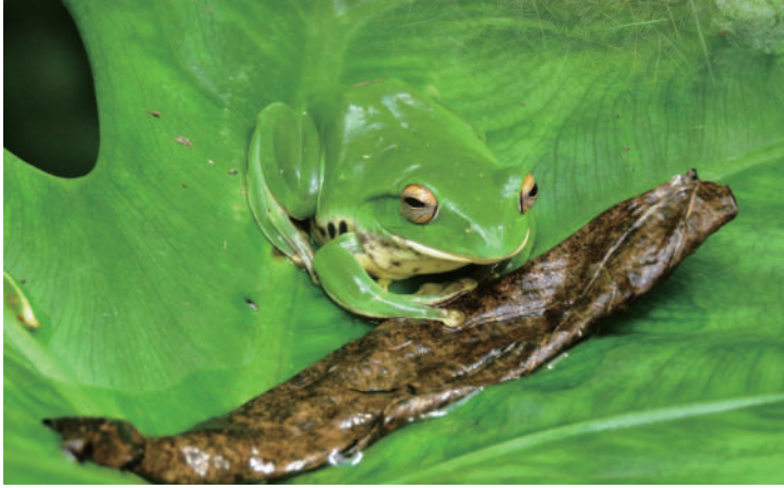
▲ 荒野 1 號地 - 莫氏樹蛙

客一同走出戶外，觀察記錄週邊的自然生物。此活動起初是由洛杉磯自然歷史博物館和加利福尼亞科學院共同發起，他們在 2016 年舉辦舊金山跟洛杉磯兩個地區的對抗賽，利用比賽時間為期八天，哪個地區記錄到的物種最多，則為贏家，此活動結果迴響熱烈，2017 年擴大至全美國 16 個城市舉行，進而在 2018 年開始成為國際性的活動，直到 2019 年共有 159 個城市及地區參賽（嘉義 2019 年加入），超過 3.4 萬人參與，回報了 92 萬筆的觀察記錄，記錄到 3.2 萬個物種。