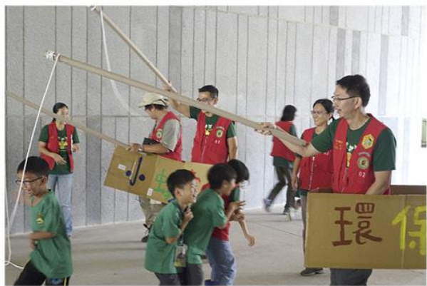
▲ 蟻團 - 親子共學

當今許多環境的問題均源起於對自然資源的過度擷取，因此保護自然需從不浪費自然資源開始，實踐簡樸生活並不會影響生活品質，因為維持生活所需，想要的通常遠超過需要的。如何學習簡樸生活？營隊中的“靜默用餐”與“光盤計畫”是我常使用的方法，靜默用餐除了能避免因交談而忽略了食物的美味，還能培養對食物的尊重與感恩，而感恩食物的最佳表現就是不浪費食物，把盤中佳餚吃光光。結束營隊時，請營員於離營前檢視自己的行李，看看還有哪些物品沒有派上用場？也是分辨什麼是“需要”與什麼是“想要”的體驗學習。