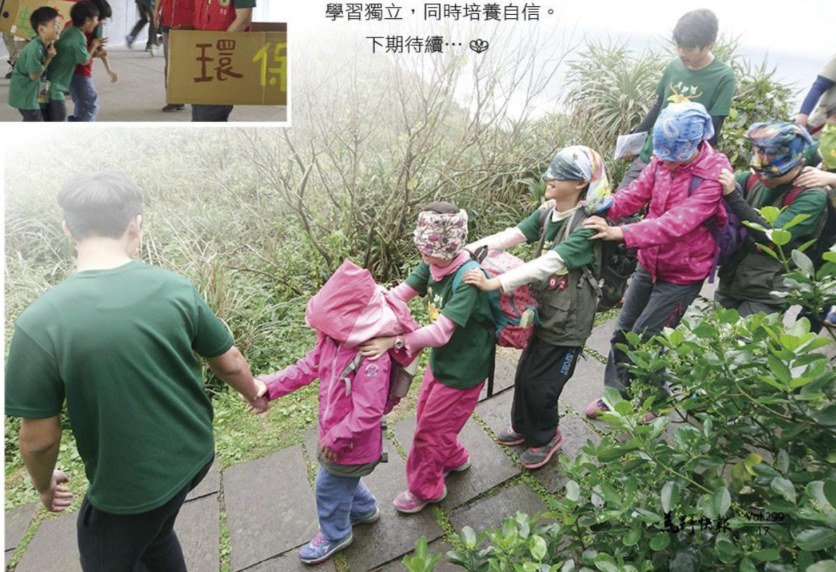
► 翔鷹團 - 翔鷹帶小蜂