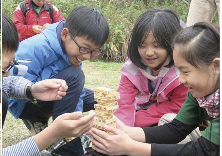
▲ 蜂團 - 團隊合作

實踐友善環境的生活型態是最簡單的環保行動，人人都可以做，只需在日常生活中常常省思能否有更環保的作為，並願意改變陋習朝環保的方向前進即可。我相信，大多數人都願意支持生活環保，只是不知道該如何做，因此稍加提醒之後，通常都會樂意去嘗試，久而久之就能形成良