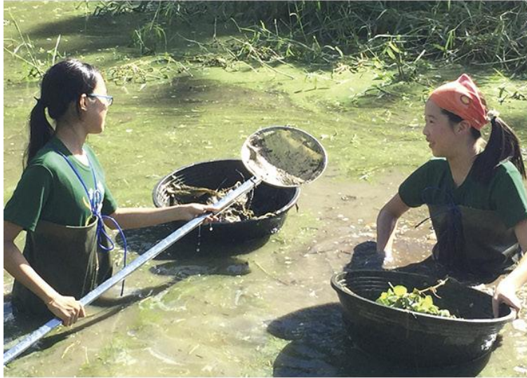
▲ 奔鹿團 - 工作假期