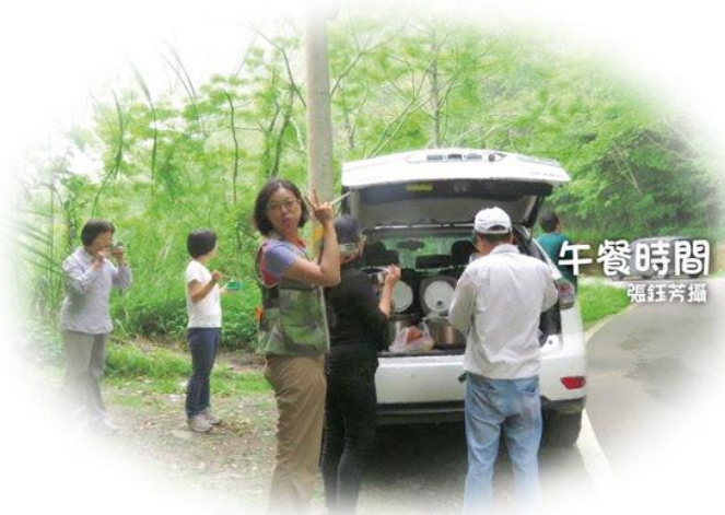
午餐時間

也還記得山溝邊，淡紫典雅的川上氏堇菜、白花點點的喜岩堇菜，長在樹枝間清麗的臺灣梵尼蘭，沿路白花盛開的烏皮九芎、大葉溲疏、破布烏、華八仙與如紅莓般果實的硃砂根。還有更多不及備載的植物與蟲、蝶所帶來的驚嘆，回顧這山林中的花朵身影，仍飽滿而鮮活的印記在腦海中，滋養而喜悅！