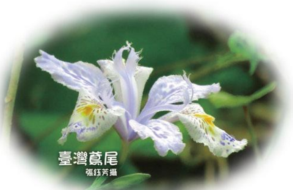
臺灣鳶尾

由錦屏來到青蛙石清爽怡人的四月天裡，蒼翠山崖、潺潺溪流碰撞岩石，使得空氣清涼而飽含水氣，忍不住深深的吸一口氣。溪邊岩壁上一片火紅的金毛杜鵑，吸引了我們的目光。蕨類、藤蔓與喬木的枝椏間，或長新芽、或含苞、或盛開，這個靜瑟山谷中植物、鳥獸、蟲蟻，正悄悄默默的交織演奏著熱鬧而精采的春之生命樂章。