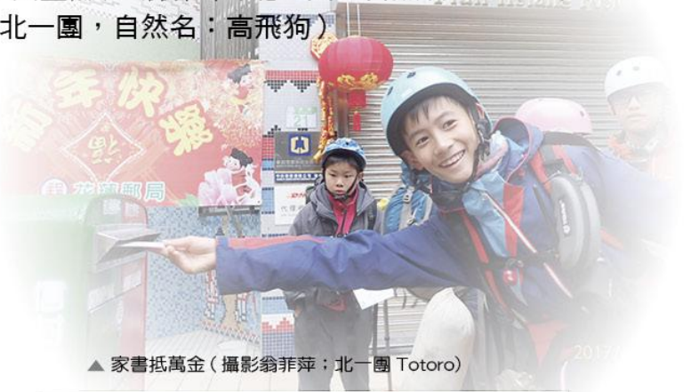
▲ 家書抵萬金 (攝影翁菲萍：北一團 Totoro)

寒假第一天的中午，爸媽送我到臺北轉運站集合，出發時，我在車上看到他們流露出了不捨的眼神，此時我努力控制情緒，我因為知道只要一發車，就不能回頭，只能勇敢面對挑戰了。從鳶峰開始，這一路的試煉已經降臨，連續九公里的上坡路，讓我們備感壓力，一路上我們有說有笑，用歡樂的氣氛來轉移走太久的疲累，不過最後大家還是無力的倒在路邊，還好有同伴及導引員的鼓勵與陪伴，使我們感受到友情的可貴與力量。一路上美景如畫，有盛開的櫻花、霧中的森林以及環繞山間的雲海；雖是如此，同時我們也發現這一片山林有受到嚴重的人為破壞，只要下大雨，中橫這一段路程就常有土石流，因此人們更在山壁中築出了一道厚厚的水泥牆，人類自以為是的認為這麼做可以停止大自然繼續破壞，在