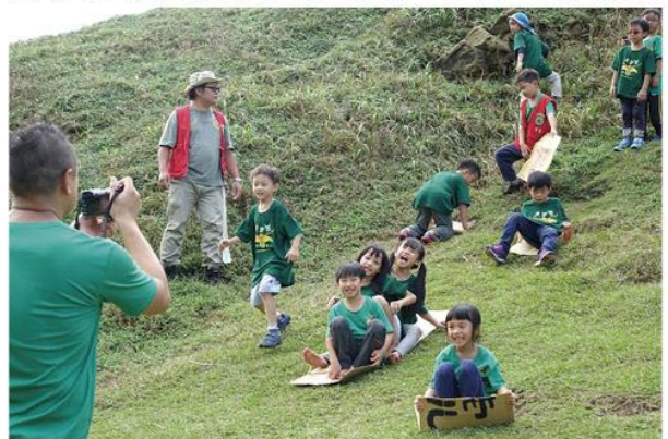
▲ 蟻團 - 玩在自然裡

不守時是對自己、其他參與者及活動帶領者的不尊重行為，因為浪費了大家等候的時間。養成守時習慣也是學習尊重的簡單作法，在自然活