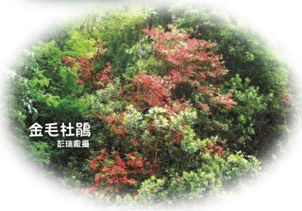
金毛杜鵑

車沿著山路往下宇老方向前行，在一處山泉汨汨細流的山坳，Fly 請我們下車往上看，哇！在一片綠叢中，一撮淡白粉紫色點綴了橘黃斑點的臺灣鳶尾，薄薄的花瓣正朵朵盛開在山壁上。往上開了數個轉彎的溝渠地上，喜見綠葉襯托中，潔白如嫁紗蕾絲典雅的臺灣附地草。在一片小喬木中，驚艷於朵朵鮮橘紅色，向下垂掛如耳飾精緻的阿里山五味子。