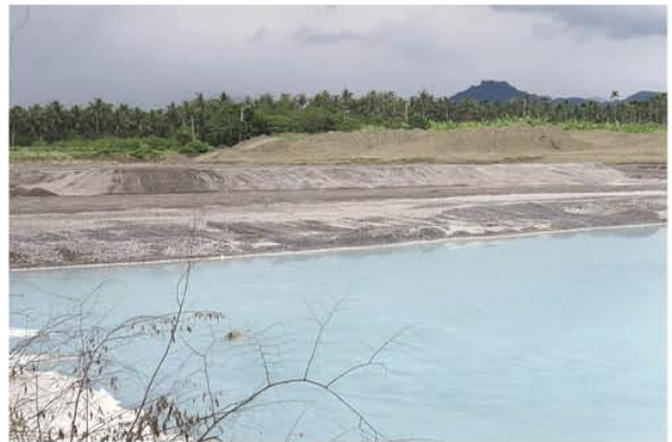
▲ 旗山水源保護區掩埋中鋼爐渣

接訂定，各直轄市施行細則也都在內政部管控下訂定。既然如此，同一個內政部營建署，設法將國土計畫的精神、內涵加到都市計畫上面，應該不是一件困難之事。最簡單的做法也許是將都市計畫法施行細則中的『保護區』與『農業區』，按照國土計畫進行分類，尤其是第一類與第二類。簡單說就是藉由修正都市計畫施行細則，將細則中過度簡化的『保護區』與『農業區』，按照國土計畫法的精神，重新進行分類，尤其是『國土保育地區第一類、第二類』與『農業發展地區第一類、第二類』。把國土計畫的精神加在都市計畫上，可以發揮國土計畫對都市計畫的指導作用。這樣國土計畫就不必另設所謂的『國土保育地區第四類』或『農業發展地區第五類』，國土計畫『國土保育地區』與『農業發展地區』的制度設計，就可以完整保留下來。就算『中央國土計畫，地方都市計畫』真的成為現實，也不必擔心國土計畫白忙一場。☺