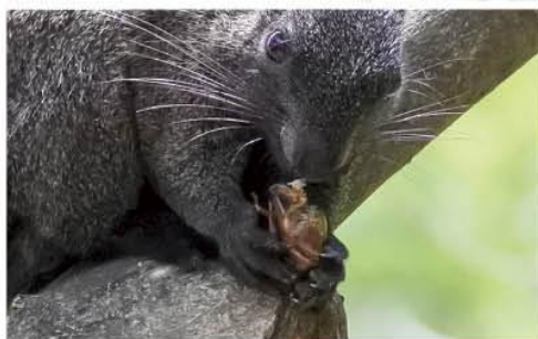
▲ 手握雛鳥啃食的松鼠