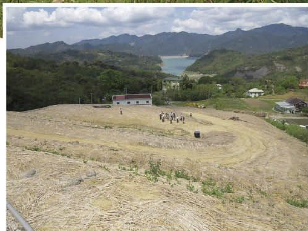
▲ 曾文水庫集水區的濫墾