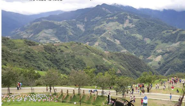
▲ 清境農場所見的山林百衲景

國土計畫法第 20 條國土功能分區分成四大類：國土保育地區、海洋資源地區、農業發展地區與城鄉發展地區，其中最受矚目的就是『國土保育地區』與『農業發展地區』。國土保育地區按照環境敏感程度分成第一類與第二類，另外還可以作出『其他必要之分類』。農業發展地區也按照農地生產資源條件分成第一類與第二類，同樣的還可以作出『其他必要之分類』。對環境保護與生態保育團體來說，盯緊這四大類的分區分類，將是責無旁貸的重任。功能分區原則定好之後，各縣市必須在縣市國土計畫公告之後的兩年內公告國土功能分區圖，到那時候國土計畫才算真正完成，而區域計畫法也要到那時候才不再適用。