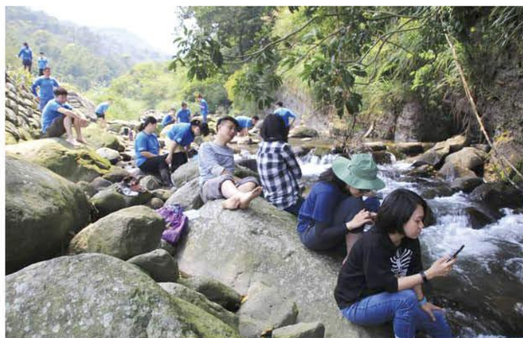
▲ 瑪鍊溪旁的午餐時間

由於我們一行人都是門外漢，所以在萬里溼地只是做些簡易的勞動，幫忙除除草，挖泥土，