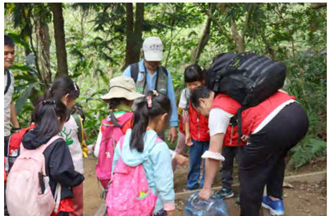
▲ 2023 年步道走讀 北一小蟻團 (富陽公園福州山步道)

從興趣、學習、成長、蛻變的過程中，剛開始也沒設定要達到甚麼目標，而是盡情的享受各項的活動當快樂志工。進來荒野保護協會就像一張白紙，荒野保護協會提供給您大自然中任何的色彩，讓每位夥伴們心中填滿精彩繽紛的色彩，構成專屬個人，自然美麗的一幅畫，我想這是最好的回饋。🌿