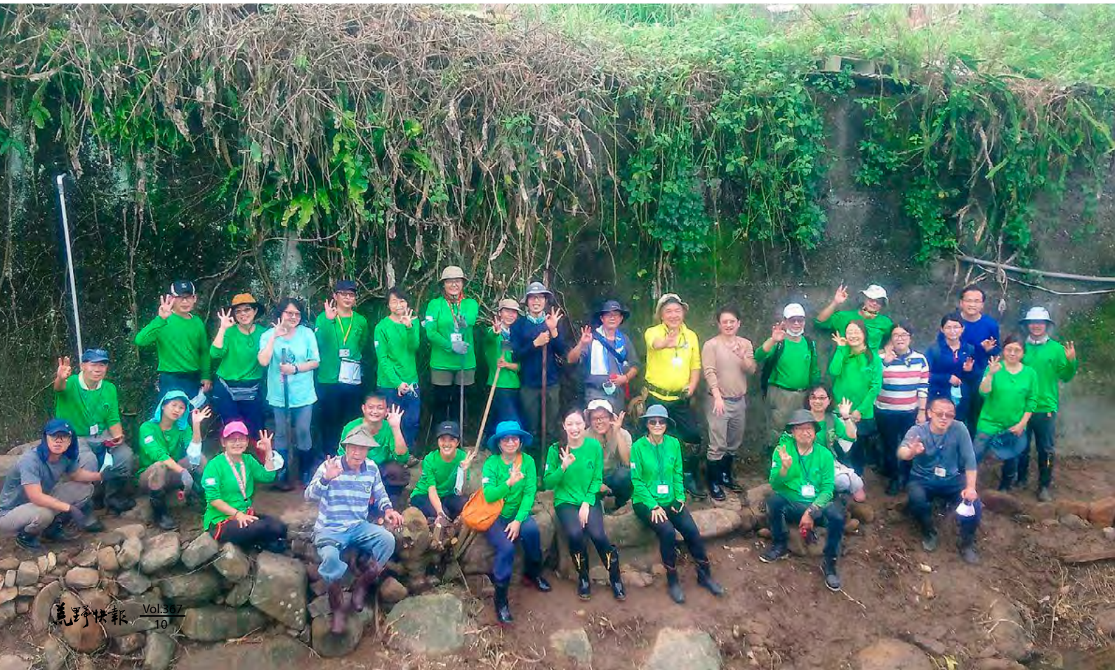
▼ 2021年荒野保護協會手作步道第三期課程訓練期中戶外實習（卯澳親水步道）

荒野保護協會在2010年手作步道成立後，認養大崙尾步道及福州山步道，斷斷續續都有在整修維護步道，在2017後才較多的時間投入。2021年年底荒野保護協會舉辦了手作步道第三期訓練課程，也擔當了課程對輔，全程陪隊員完成課程訓練，後面也幫學員補了一堂手作步道的紀錄表課程。而現在的北部三手作步道夥伴們，個個在手作步道都可獨當一面，帶領群眾手作步道，也會開始製作網袋，檢討帶民眾手作步道介紹方式改善，看見了夥伴們在手作步道中持續成長。