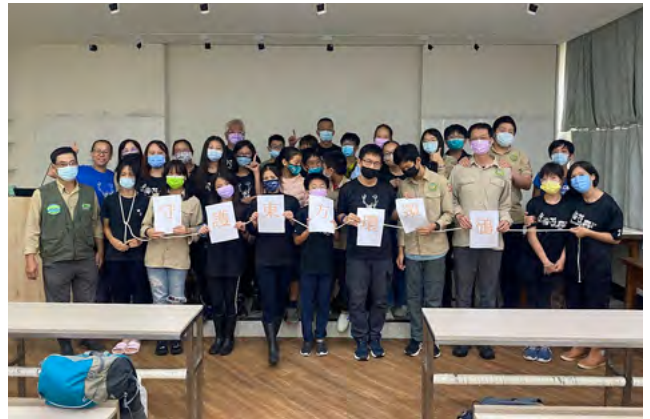
▲ 2022 年分享：台北港北堤東方環頸鸕繁殖守護 (惇敘高中)