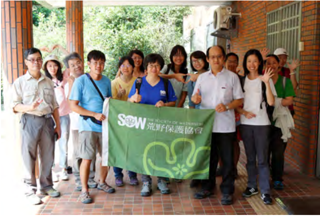
▲ 2016 年分享：五股濕地與四斑細蟪 (特生中心交流)