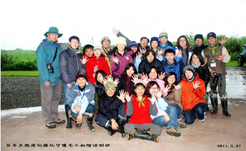
▲五股濕地自辦棲地志工訓練 (五股濕地)

在 2011 年時，五股濕地打破紀錄，定點棲地志工定點自己招募 (原由荒野分會主辦)，舉辦棲地志工訓練課程，我受邀為隊輔，以輔代訓。結訓後夥伴們參加巡守、解說、棲地、調查工作。