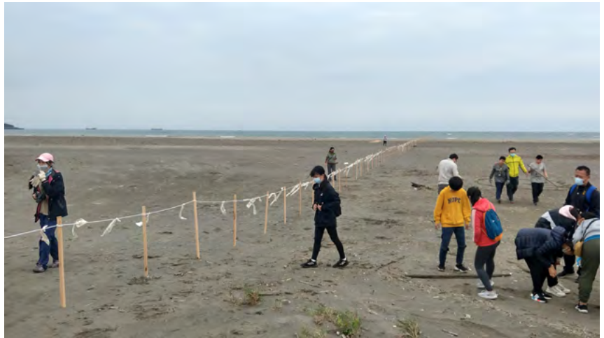
▲ 2021年台北港北堤東方環頸鴿繁殖棲地，第一次建置護生圍欄（米倉國小）。

接觸東方環頸鴿的調查是在調查鴛鴦及小燕鷗之後，東方環頸鴿同小燕鷗都是夏候鳥，因此想了解兩種鳥的差異性在哪裡。在2020年四月踏上台北港北堤東方環頸鴿繁殖棲地。剛開始看到有汽車、機車、人、狗等在棲地活動，心裡面真的非常難過！相較之下，桃園小燕鷗有圍籬、有志工排班巡守，小燕鷗是幸福多了！隨後陸續把桃園小燕鷗的守護經驗方法帶過來，在2021年夥伴們努力下，東方環頸鴿棲終於建立第一條護生圍欄，讓東方環頸鴿有較好環境下繁殖。