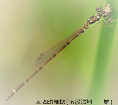
▲四斑細蟴 (五股濕地——雄)

賞鳥也是在五股濕地養成興趣後，進而學習拍鳥，在石門水庫建立了賞鳥路線。參加 BBS 訓練 (台灣繁殖鳥類大調查) 後，石門水庫賞鳥路線成為 BBS 調查樣線，從賞鳥拍鳥變成科學公民。也參加桃園鳥會二期藍鵲解說員課程，陸續參與東方環頸鴿的調查、鴛鴦調查、小燕鷗調查，進而守護棲地及埤塘。當時也積極的參與各項活動與訓練課程，不停的賞鳥、拍鳥、調查、登山、走步道，在有形無形之中得到很多學習的機會。