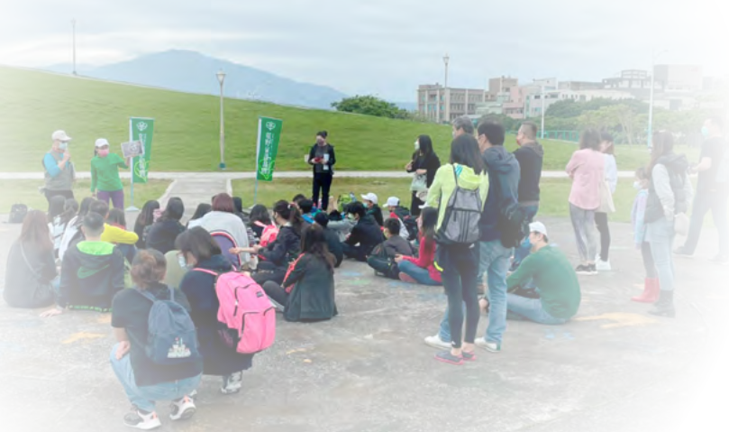
▲ 2022 年東方環頸鸕護生圍欄解說 (八里十三行文化園區)

2016 年又有了新的改變，從荒郊野外的志工開始走上室內講台分享生態講座。從主題：小燕鷗守護 (桃鳥會員)、五股濕地與四斑細蟪 (荒野調查夥伴 特生中心)、2018 年參加國際濕地大會 濕地方舟護里山論文報告，以基隆河社子島濕地四斑細蟪生態調查及志工調查基地建置 (與會人員)、2019 桃園鳥會頒發解說員解說證、(桃園鳥會帶解說)、2021 年桃園市野鳥學會歷年手護鳥棲地 (六期藍鵲解說員)、快樂志愛工守護生態棲地 (開南大學學生)、2022 年東方環頸鸕繁殖棲地護生圍欄總召 (康橋中學)、台北港北堤東方環頸鸕繁殖守護 (北七親子團)、夏日濱海候鳥饗宴 小燕鷗與東方環頸鸕 (開南大學學生)、手作步道講座 (北一團育成會)、福州山步道手作步道走讀 (北一團小蟻)。感謝夥伴們的推薦及好友的邀請，讓我有這麼多的機會站在講台上。