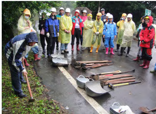
▲荒野保護協會 第一期手作步道(金山)

當時手作步道開始興起，由溪山組推行了荒野保護協會第一期手作步道，也報名參加訓練，成為荒野保護協會第一期手作步道志工。