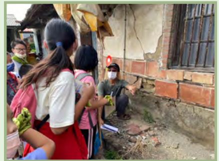
清代大磚老屋 ~ 這塊紅磚不一樣 ▼ 導引員說明大塊紅磚和近代紅磚的不同 ▼ 小孩每人用手測量記錄