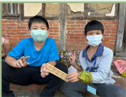
任務：製作出編竹夾泥的牆壁， 體驗先人是如何蓋起一棟大厝。