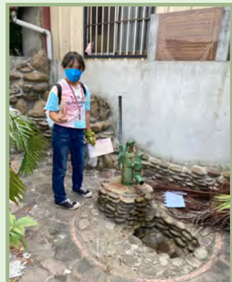
烘爐井~是社區飲用水源