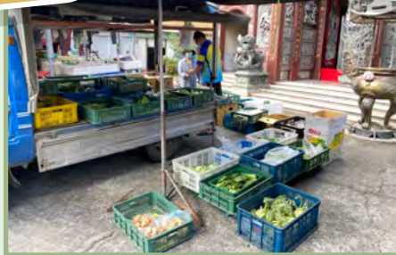
來社區賣菜的菜車，可以用「當地市集」 的 ICON