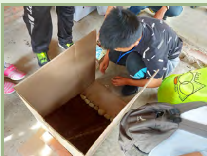
石頭堆砌工法 (必關關卡) 小小建築師快來蓋房子囉！ ~ 了解古代人居住曲溪大不易啊