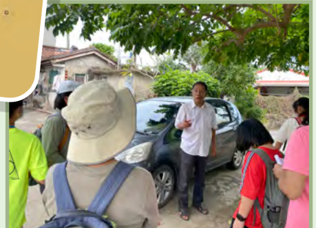
任務：訪問社區的阿公~ 拜訪大厝的後代，跟他們聊聊現在 的工作生活和祖先來的時候有什麼 不同