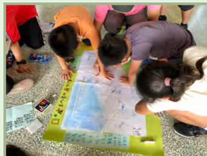
製綠色生活地圖及 ICON 應用