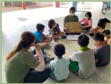
社區大富翁 ~ 出發前小隊分配工作與討論