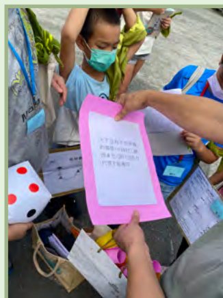
還有好玩的機會跟命運，增加趣味度。