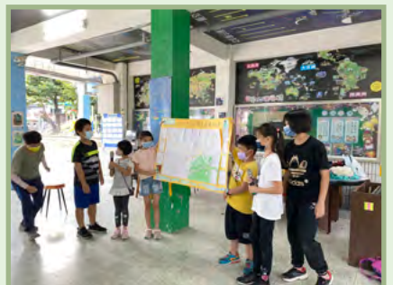
分享社區綠色景點與所繪製綠活圖的故事