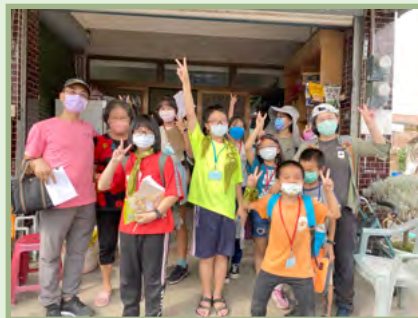
任務：採訪資深美女，幫資深美女拍攝 美麗沙龍照。訪問到的是二溪國小 畢業的大學姐，阿嬤聽到孩子喊她 大學姐，笑的嘴巴都合不攏了