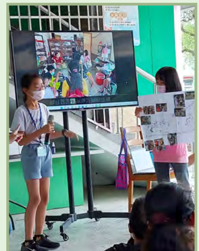
各小隊整理社區踏查的內容與照片，分享活動