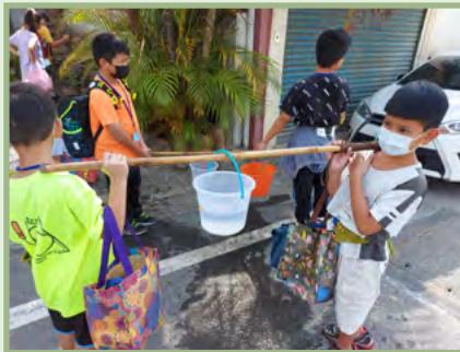
烘爐井挑水 ~ 體驗先人用水的艱辛