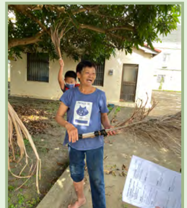
綁掃帚 (必關關卡) ~ 社區阿嬤教孩子綁