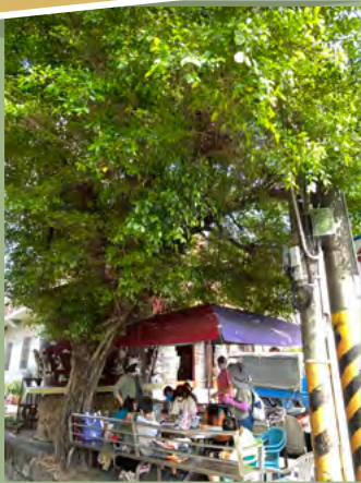
社區綠活圖走讀~北天宮樹下 討論應用 ICON

任務2: 找個社區印象深刻的地方， 幫他取個有特色的名字， 說明一下取這名字的理由。