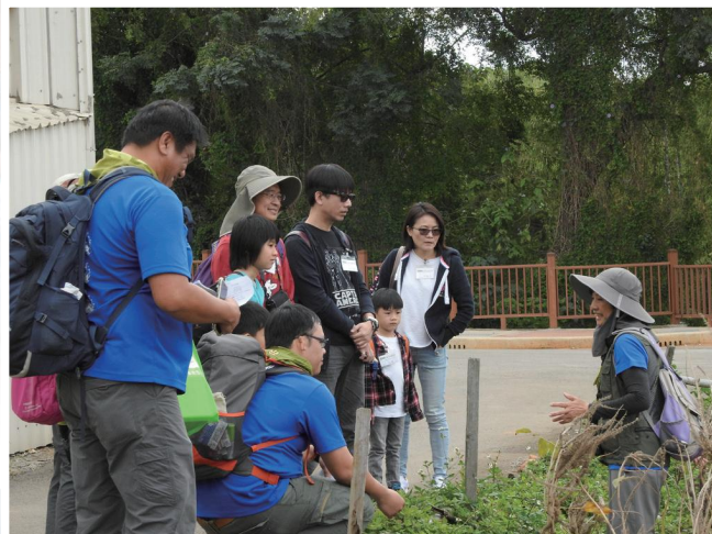
▼ 斗笠在第一關向民眾解說大肚山耐旱作物狗尾草 (18 解濕地拍攝)