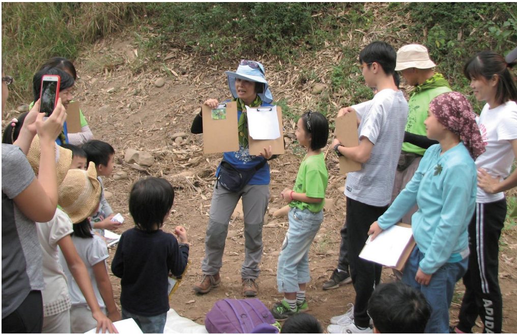
◀ 大家團團圍住等著展示自己所繪世界名畫