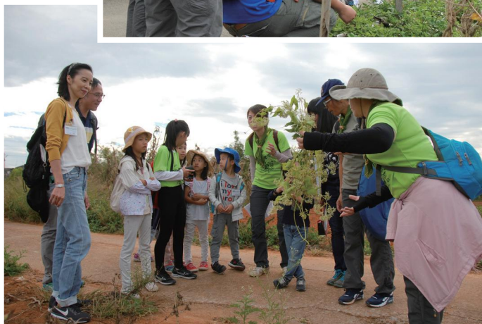
▲ 天荒地老說明銀膠菊小花蔓澤蘭的危害 (17 解小雨滴拍攝)

自從承諾願意擔任「107 年戀上大肚山推廣活動」的總召，我是焦慮的，因為自己玩得開心是一回事，要帶領民眾領略自然之美是需要