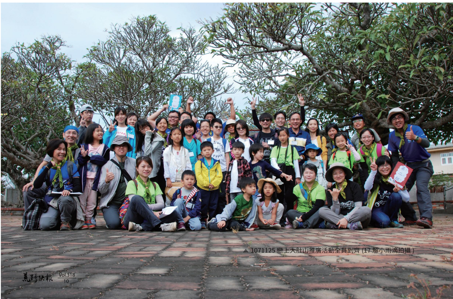
▲ 1071125 戀上大肚山推廣活動全員到齊 (17 解小雨滴拍攝)

居住的大環境，課程中的主題有：「那山那土地、期初宿營、野生動物救援其中的一雙腳、植物生態、昆蟲生態、生態遊戲設計、棲地守護 - 移除外來種、各定點介紹（大坑、大肚、勝興、霧峰、十八灣、合歡山）、自然筆記、非正經教育、鄉土關懷、期中旅行、各組生態遊戲討論與演練、與荒野同行、荒野的腳步與願景、荒野解說的組織理念與實務、期末旅行、解說演練、自然觀察報告、土地倫理與棲地守護、成為一個生命精彩的解說員…」，每堂課程都相當精彩，每一堂課都蘊藏著講師對受訓解說員深深的期待，而每個主題背後都有與講師息息相關的生命