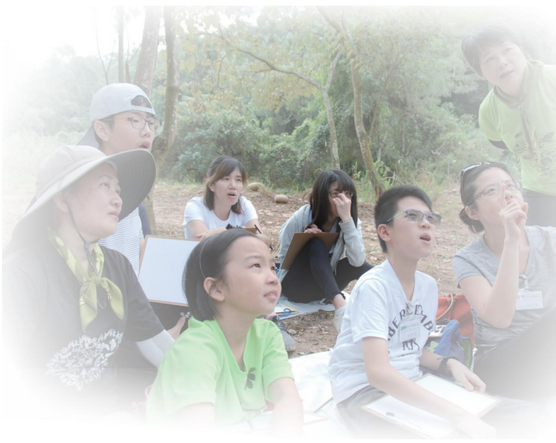
▲ 不論大人小孩大家都專注認真的觀察

夥伴斗笠一開口解說狗尾草、扁擔，那會是她生活的一部分，由她解說特別有感情也讓人有溫度；夥伴二葉松溫吞卻帶有個人美麗的解說魅力，還是讓民眾很有共鳴，當他化身大肚魔王，額頭上貼滿小朋友為他裝扮的小花，便成了目光