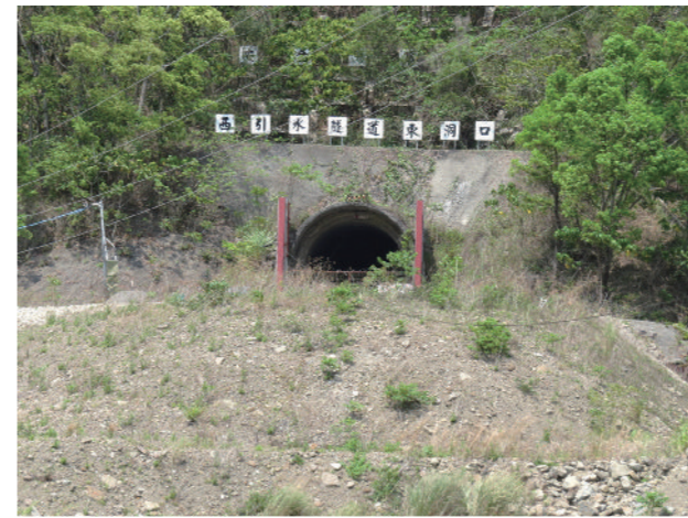
▲ 停擺中的曾文越域引水工程

玉峰堰更重要的作用是：確保曾文溪不受污染。曾文溪水系的曾文水庫、南化水庫、鏡面水庫，乃至玉峰堰，共同承擔臺南地區民生、工業、灌溉的絕大部分用水。曾文溪就是臺南人的生命