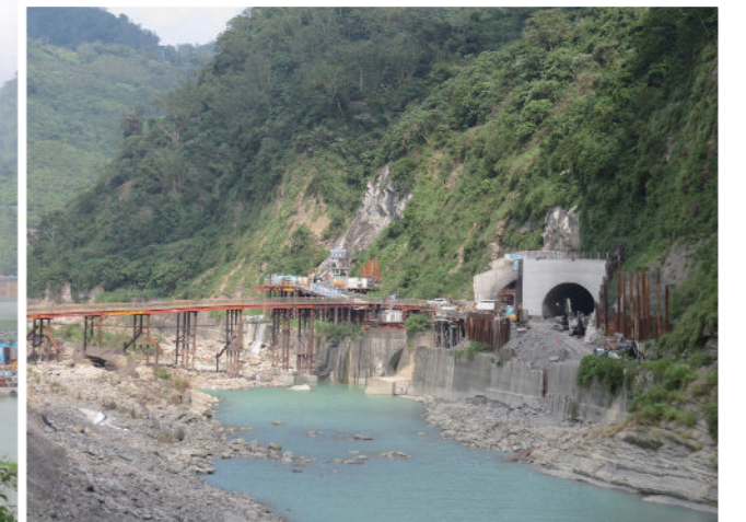
▲ 進行中的曾文水庫防淤隧道工程

讓一條河流死亡是一件容易的事，但是要讓一條死亡的河流起死回生，卻是困難重重。曾文溪是臺南人的母親河，臺南人不應該讓這條神聖的河流遭受豪強政客的侵害。我們必須把好山好水留給子孫，不能繼續剝奪子孫該有的國土、環境與水資源。☺