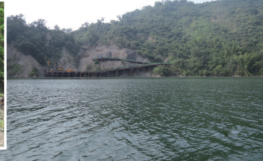
▲ 進行中的南化水庫防淤隧道工程