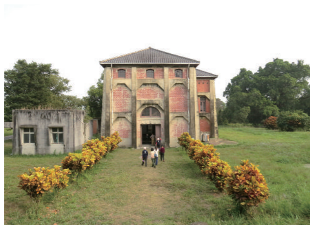
▲ 山上淨水場日式建築為國定古蹟

供水問題可以做個徹底解決。可是，這項工程在2009年莫拉克颱風時嚴重毀損而全面停擺。南部各水庫嚴重淤積，曾文水庫與南化水庫的有效容量都只剩下原設計庫容的六成。無論怎樣清淤，頂多只能減緩今後淤積的速度，而無法恢復原有的庫容。南部地區開發新水源基本上已經不可能，如果一直只想著開發新水源，而不願去保護既有的水源，那只是捨本逐末。玉峰堰經由山上淨水場每天平均供應4.5萬噸的民生用水，足以讓18萬人不愁缺水。在南部地區缺水問題日益嚴峻的情勢下，玉峰堰仍是臺南人的重要水源。