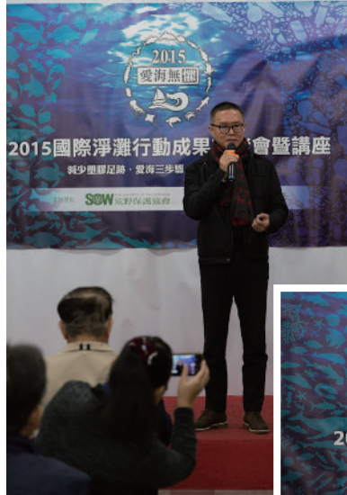
▼ 行政院環保署環境衛生及毒物管理處處長 袁紹英

荒野理事長理賴榮孝再次呼籲: 「海洋是人類重要的資源, 更是地球上最廣大的棲地。從今年十大海洋廢棄物排名分析, 除了排名第二的漁業用浮球外, 其他 9 項都與民眾生活相關, 顯示臺灣民眾的消費、丟棄習慣與生活的廢棄物管