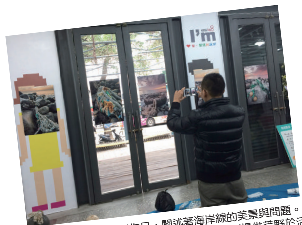
▲ 一幅幅美麗的攝影作品, 闡述著海岸線的美景與問題。國立政治大學廣告設計系吳岳剛教授特別提供荒野於活動展出