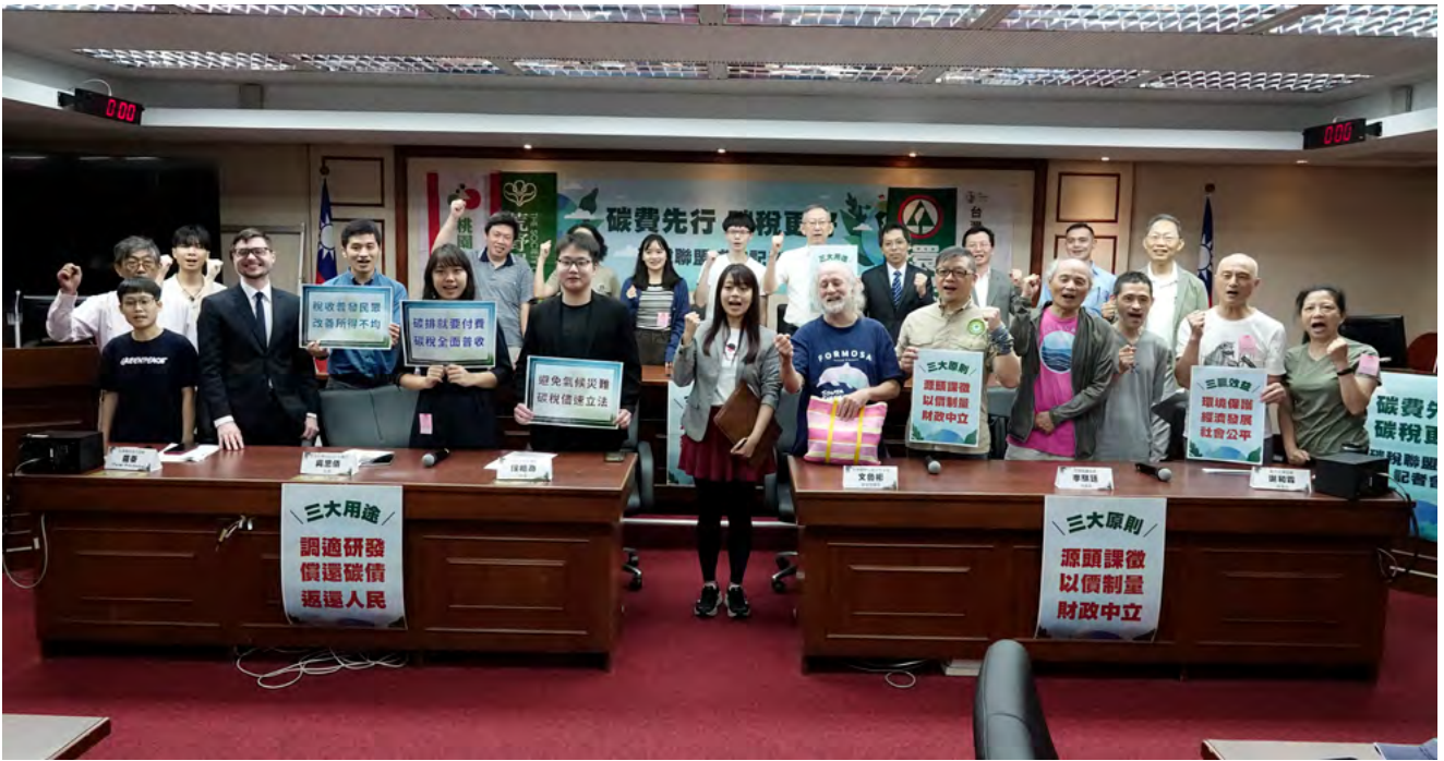
▲今年六月由學者和三十多個民間團體於成立碳稅聯盟，呼籲政府需儘速規劃碳稅在 2026 年取代碳費成為更有效的減碳政策工具。

2. 可以累積 碳債基金 或 碳債責任歸屬 、讓年輕世代可以移除大氣中多餘的碳，以力求全球升溫控制在 1.5 度 C。