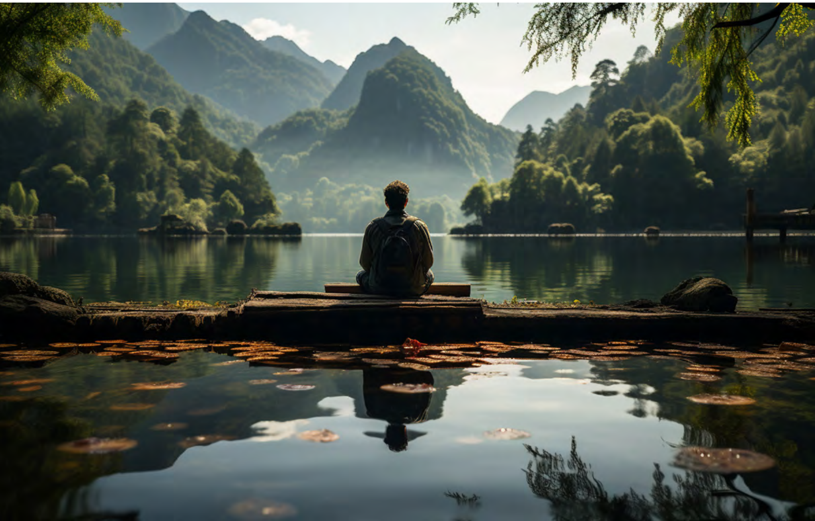
▲ 在我們致力守護所愛的棲地與其珍貴生態時，未來氣候變遷帶來的各種災難卻可能將之摧毀於一旦。

註 3：請見上下游報導：碳費 Vs. 碳稅，哪一種能促進減碳？、今週刊報導：別留碳債給子孫！ 28 個民間團體成立碳稅聯盟，主張「碳費先行、碳稅更好」