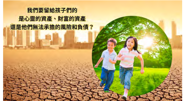
▲ 我們要留給孩子們的、是心靈的資產、財富的資產，還是他們無法承擔的風險和負債？