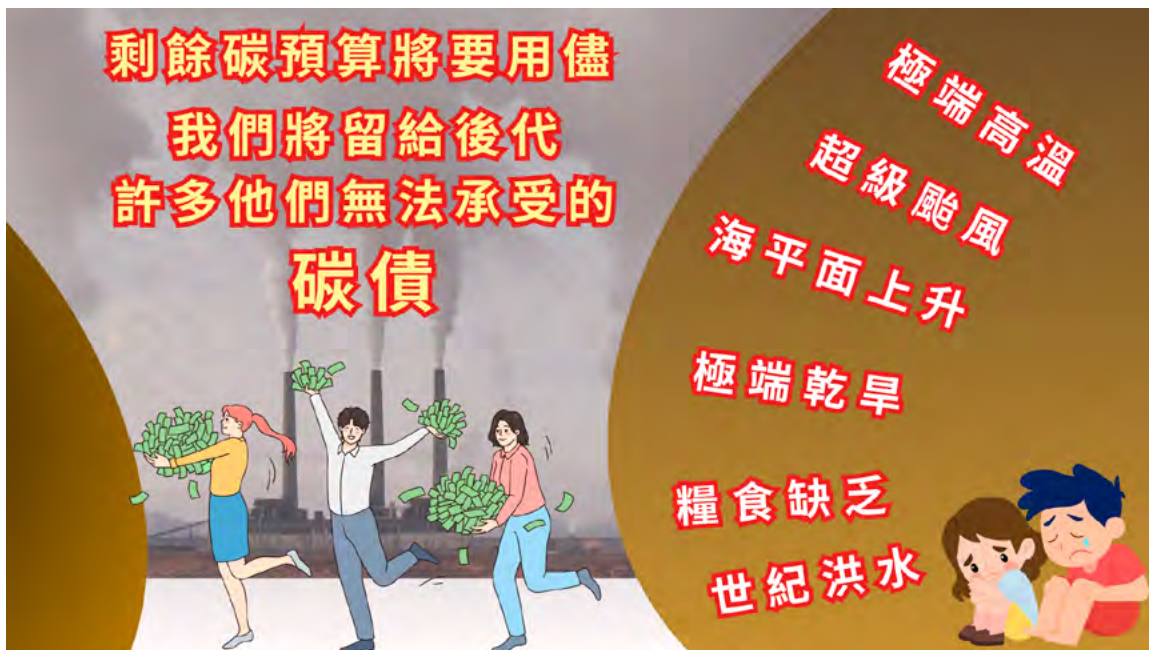
▲ 碳預算即將用完，留給年輕世代的將是他們無法承擔的碳債