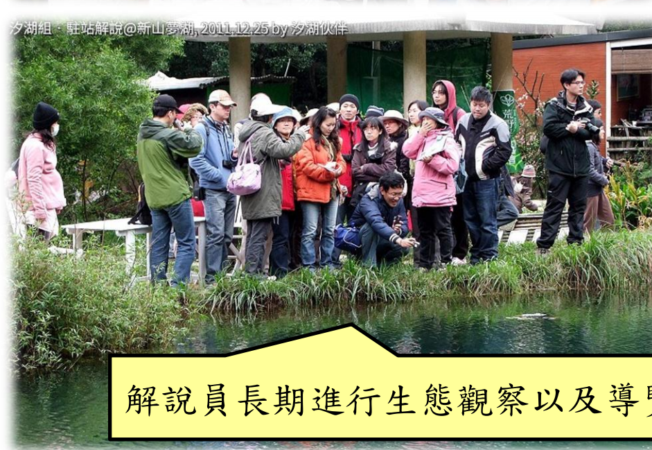
夕湖組 · 駐站解說@新山夢湖, 2011.12.25