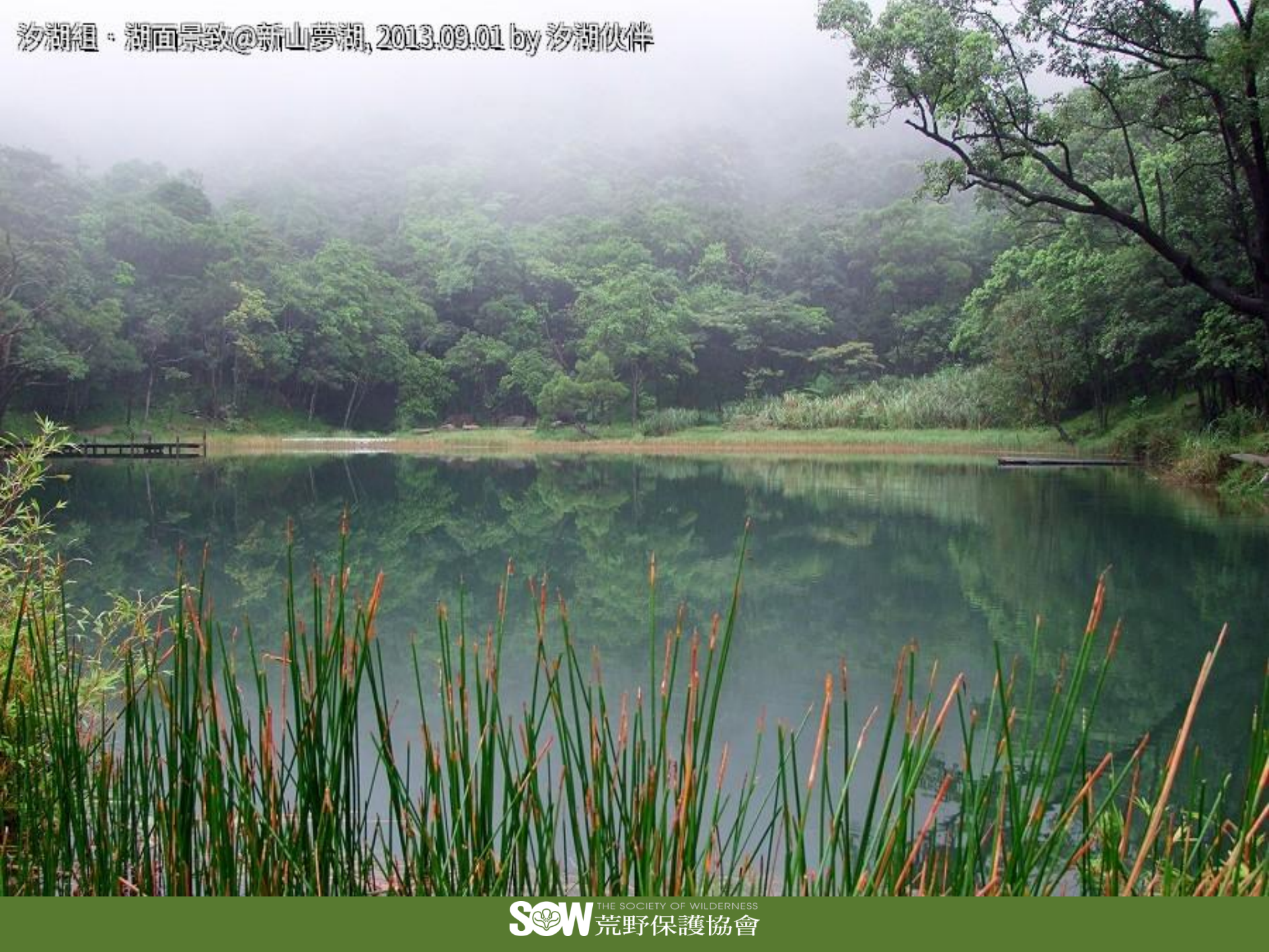
汐湖組 · 湖面景致@新山夢湖, 2013.09.01