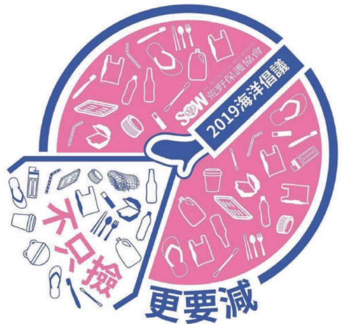
▲ 2019 淨灘不只撿更要減 slogan

當「每天」手拿冰霸杯已經成為習慣後，似乎背包固定有一個空的便當盒，一個空的購物袋，出門想一下需不需要帶保鮮盒？有時候忘記帶保鮮盒就店內吃，看到想吃的小吃沒帶便當盒就不要買了，當減肥。之前覺得很麻煩的事，就像溫水煮青蛙一般，慢慢的就習慣了，就熟了，這就代表魔化成功了！