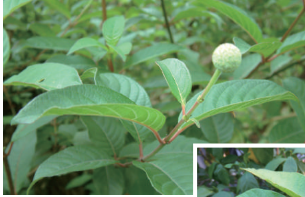
▲ 又名水芭樂的風箱樹

風箱樹 (Cephalanthus naucleoides) 為茜草科風箱樹屬的落葉型、喬本水生植物，質地輕韌，早期多取材製為打鐵用的「風鼓 (手風櫃)」而稱名「風箱」。葉呈波浪橢圓且對生或輪生，大多圖鑑都會描述他們的葉為對生型態，但在我的種植經驗裡，卻多是呈三葉輪生型態的，節節抽展，葉長 9 到 18cm、葉寬可達近 10 公分，貌似芭樂，所以又名「水芭樂」，你想到了另種在生態浮島上，同樣有著相似命名原則的——水香蕉；花期多在每年 5 到 10 月的初、盛夏時期，初綻的「頭狀花序」就像潔白探頭的調皮精靈，模樣滑稽討喜，只是你現在想再去找這有趣的樹與花得要靠點運氣了。他們的花跟葉卻都是蝶、蛾類偏好的蜜源與食草 (註 3)，就算對沒有食用或蜜糖需求的我們人類而言，他的樹姿花形依舊有辦法強勢吸引我們眼球的