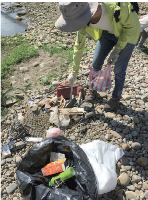
▲ 垃圾都需要分門別類

淨川除了撿垃圾，還有一件重要的任務，就是利用 ICC 表格做紀錄。除了垃圾能分門別類，其最主要是能夠知道哪種垃圾量最多。在這講求數據會說話的年代，有了數據才能精準地進行議題倡議或是政策修改。在淨川的現場，可以看到三群人分別進行不一樣的事情：一群人在撿垃圾；一群人分類垃圾；一群人記錄垃圾。比起單純撿垃圾，三道程序確實更加繁瑣，但也因為有紀錄，才能夠更加了解「淨川」這件事情。