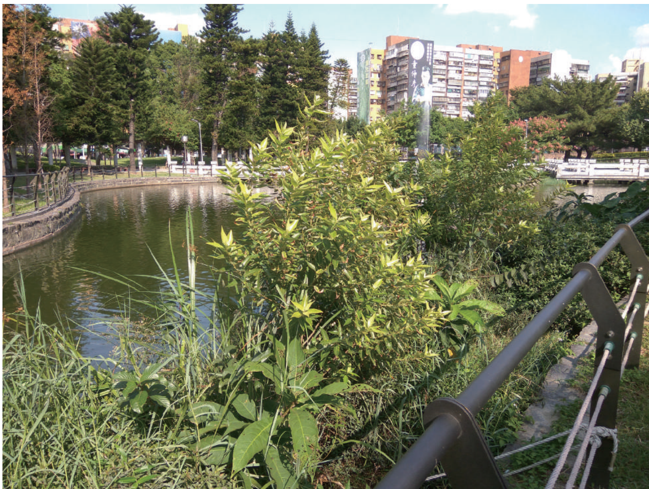
▲ 青年公園生態浮島如今的植況——各種草、木本水生植物茂密生長著

幾早便趁涼入園走看，步道旁的低矮灌叢、苗圃裡的攀藤植物，都還留著經過前一天、甚至前一晚的日曬悶熱後的凋萎貌容，巴望著待會工務水車來時，能多幫他們澆點水、解點渴了，而熱心一點的民眾哪待到那時，早早就自發提著水桶寶特瓶，把苗圃澆灌了一輪，讓園內植草重展生姿。但不知你有否好奇到，泊靠在蓮花池池岸已超過半年的生態浮島上頭的植栽，卻怎能始終保持著茂發昂揚的狀態，即便期間未見工班人員澆水、施肥？