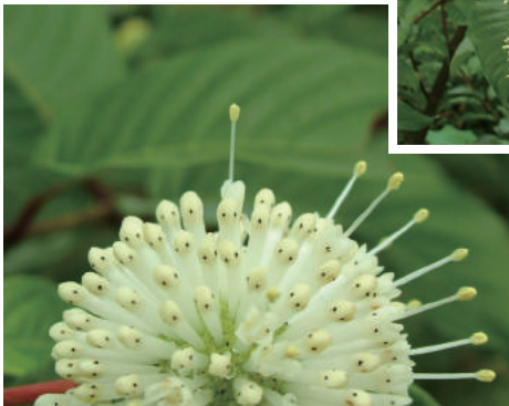
◀ 風箱樹的頭狀花序