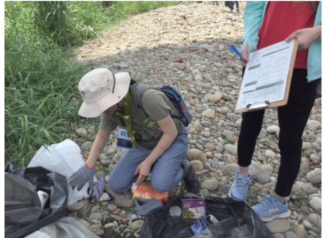
▲ 使用 ICC 表格做紀錄