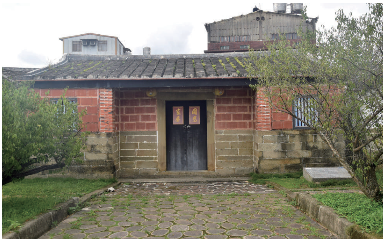
▲ 金廣福公館是大隘拓墾的總部及隘防指揮中心

人陸續移民開墾後，劃界設隘，防範族群間的紛爭。道光十五年（1835）年，姜秀鑾、周邦正等人合組「金廣福」墾號，在當時竹塹城東南方地區進行大規模拓墾，將上游的寶山、峨眉、北埔地區都納入墾區，沿線架設槍械守禦，敲竹筒木魚傳聲聯絡，建立起廣大的隘勇線做為族群間的防備，俗稱「大隘」。