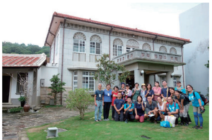
▲ 在姜阿新洋樓為三天二夜的工作假期做了完美的總結

石崁古道本身除了部分路段仍需調改、修整、補足指標外，還有周邊環境整潔、通行權的問題需要處理，更時不時面臨道路開發的壓力。幸有荒野夥伴看守著這片淨土，至今才能維持目前的自然狀態。與樟之細路締結友誼的韓國濟州偶來徒步協會理事長徐明淑，於2018年走訪石崁古道時，提出步道發展觀光利大於弊的看法，而這有賴公部門與民間組織的通力合作，以及人民觀念上的轉變，加強步道的例行維護以及公眾教育，才能營造永續美好的空間，讓綠道的推展持續下去。❤️