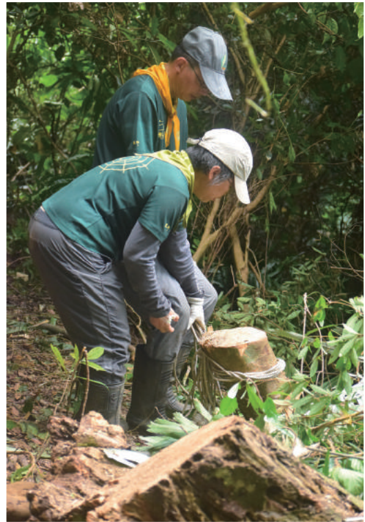
▲ 準備將鋸下的風倒木拉回步道運用

這片山林在幾十年的休養生息後，已成為荒野人的尋寶觀察去處，幾年前甚至搭建竹橋跨越溪谷。而今，為了促成以自然工法整建綠道的願景，荒野與千里步道協會攜手合作，展開了古道的修復與守護行動。