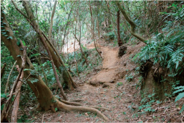
▲ 改道後的步道蜿蜒於樹林之間

難之處，也是這二天的工作重點。志工們在助教帶領之下，一組在溪裡尋找合適的石頭，埋設上岸石階；另一組則是處理改道，讓路徑斜斜緩升，避開幾近垂直的拉繩路段。在清出植被確認路線後，大夥就地取材，合力固定木頭做為護坡，以大小塊石仔細回填空隙，最後用碎石和泥土夯實表層，坡度較大處以風倒木或清理路面時挖出的塊石設置階梯，易於行走的自然步道於是成形。