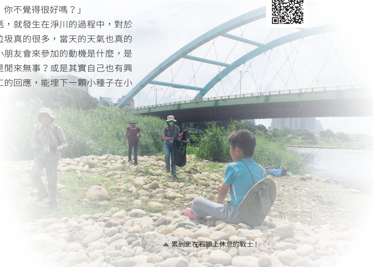
▲ 累到坐在石頭上休息的戰士！