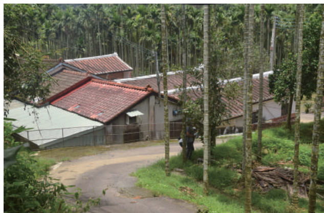
▲ 清河堂的後方是過去石崁古道的路徑

追溯時光，發源自鹿場大山的中港溪，流過新竹、苗栗的淺山丘陵，沿途的山林和水域資源，餵哺了道卡斯、賽夏等原住民族人。在漢