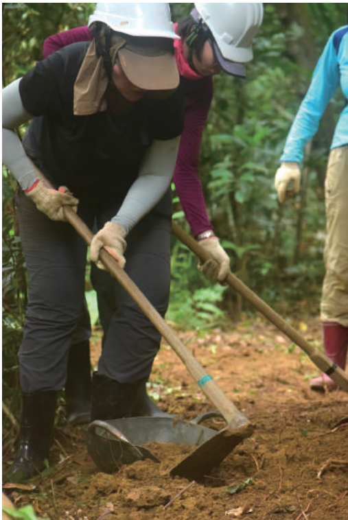
▲ 雙手不停歇地清理出步道路跡

「山歌唔唱唔記得 老路唔行草生塞。」飛鼠的父親悠悠道盡滄桑。二次大戰後，臺灣茶業的競爭力漸漸不敵世界其他茶產區，加上產業轉型，茶園間四通八達的老路慢慢被大自然收回，徒留殘瓦、駁坎靜靜守候。