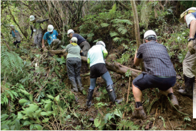
▲ 粗壯的木頭需要眾人合力才能移動做為護坡

北臺灣中低海拔的淺山地區是樟樹生長的絕佳環境，提煉出的樟腦傲視全球，曾經是臺灣的重要出口品項，大隘地區亦然。在林木資源的開採告一段落後，偏酸的疏鬆壤土成就了茶葉的興起，小綠葉蟬的親密接觸之下，東方美人茶膨風紅到國外。茶葉從山區一擔擔挑到北埔再運向桃園三坑，一船船順大漢溪至大稻埕，接軌國際市場。這條產業之路在歷經二年的踏查規劃下，定名為「樟之細路」，納入國家級綠道的一環。