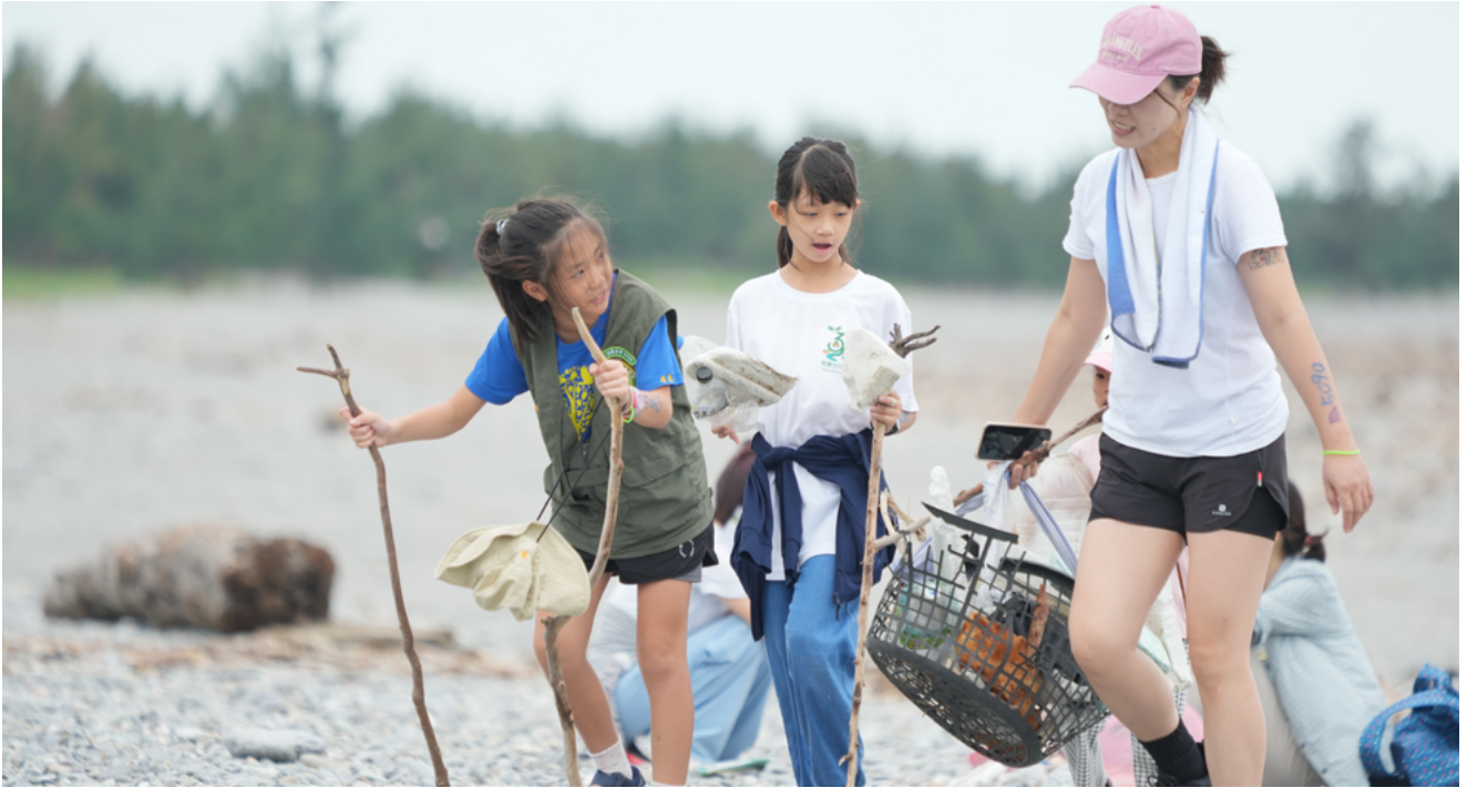
▲ 跑著跑著，居然有淨灘任務？

一場「路見不平，任務繁多」的路跑，許多人跑著跑著早已忘卻他是來路跑了，沿路欣賞美景，並且化身成為救地球的勇者。抵達終點線後，還有一個小任務——愛地球大拼圖，拿著拼圖的親自貼上，小小的一舉動卻感動滿分，因為他已將自己歸為愛地球的一份子，親自在這裡種下這棵溫暖的綠色小苗。