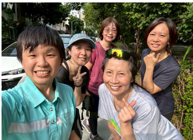
▲ 準備繪製工作前來跑一下也是很重要的

虎可愛的模樣嗎？跑步結束，我無法回答這些問題，但心裡清楚知道，只要繼續參加守護筏子溪的行動，持續陪伴每次前來參與活動的民眾們，最後總會知道答案。