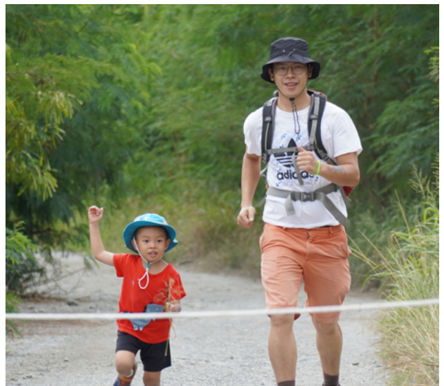
▲ 哇！是你首先衝過終點線的嗎？

動的夥伴說，真正環保的路跑要辦真的非常困難，要做到「零浪費」，讓參賽者感動更難，但是我們做到了！活動結束時我們只有一袋大號的垃圾袋（重量也很輕），裡面沒有任何一次性餐具，因為全場的攤商除了準備美食外，還準備了樹葉等自然物包材包食物；雖然這次的活動很可惜沒有被更多的人看見，非常可惜，但相信在場的將近 400 人都已對路跑產生了不一樣的想法，原來路跑可以這麼環保！最後還是要謝謝所有參與的夥伴，不論您有沒有到場，或者幫忙宣傳，我們都由衷的感謝您，期待下次的活動能有您與更多的人一同參加。❤️