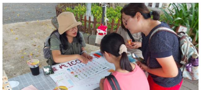
▲ 荒野台北永昌里 - 畫我 icon 中秋節擺攤推廣

在綠活圖的視角下，我們實行的是 社區資產盤點 。我們尋找里內的綠地、古樹、友善店家，將焦點放在「我們擁有的美」，不只是「我們缺乏的苦」。這種正向的連結，讓荒野台北與永昌里的線上綠活圖成為了一個充滿生命力的永續資料庫。