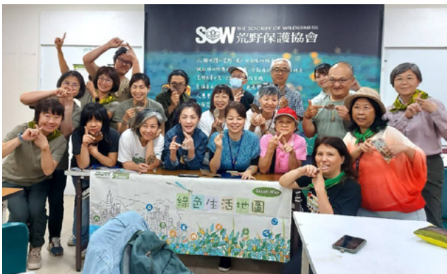
▲ 綠活圖台北第 10 期推廣講師培訓課