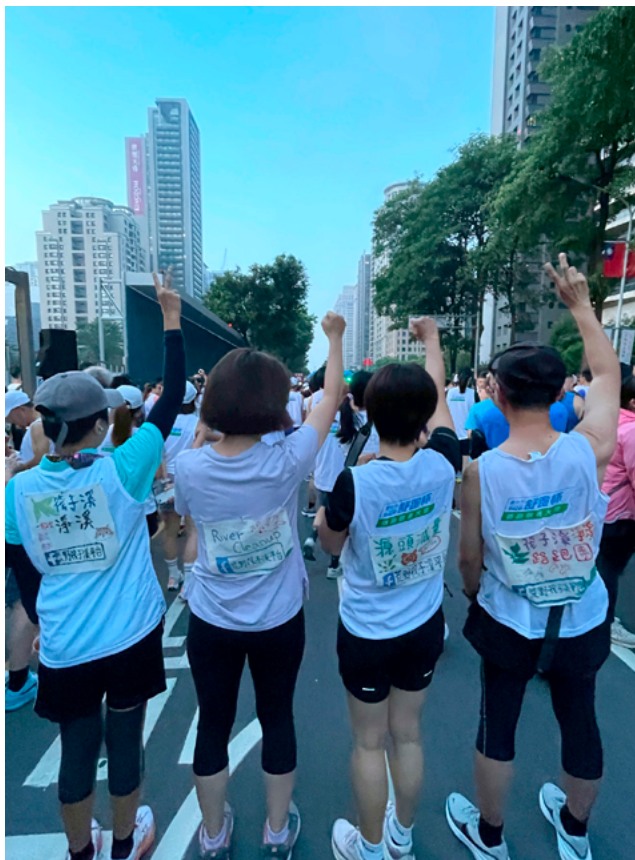
▲ 你看見我們背後的宣傳語了嗎？

歷這一段心理歷程進化到下一階段的我，開始留意觀察跑步中身體的變化。起跑幾步後，覺得身體重重的，2K 可能就有點勉強；覺得身體輕盈，3K 就不是問題，也有可能這次就達成這週的跑量。隨著耳機裡 Podcast 精采故事的推進，雙腳也不停往前邁出下一步；隨著練跑 app 的每公里報時報速，推著身體再試試看，下一公里能否進步一點？