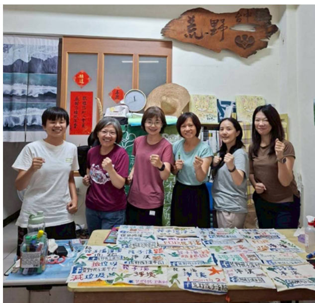
▲ 繪製宣傳標語布條也是重要的路跑前準備工作