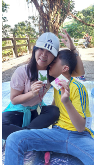
▲ 送給親愛的家人自然書籤與祝福