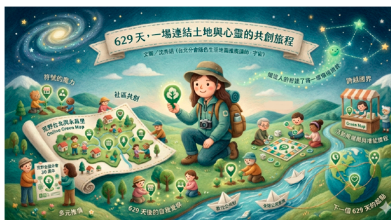
▲ 宇宙 629 天的綠活圖 ai 創作