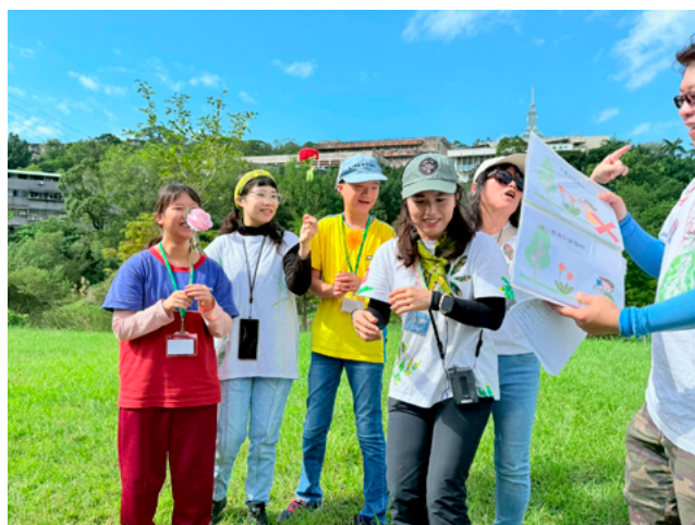
▲ 遵守公園守則，也學習進公園的禮儀