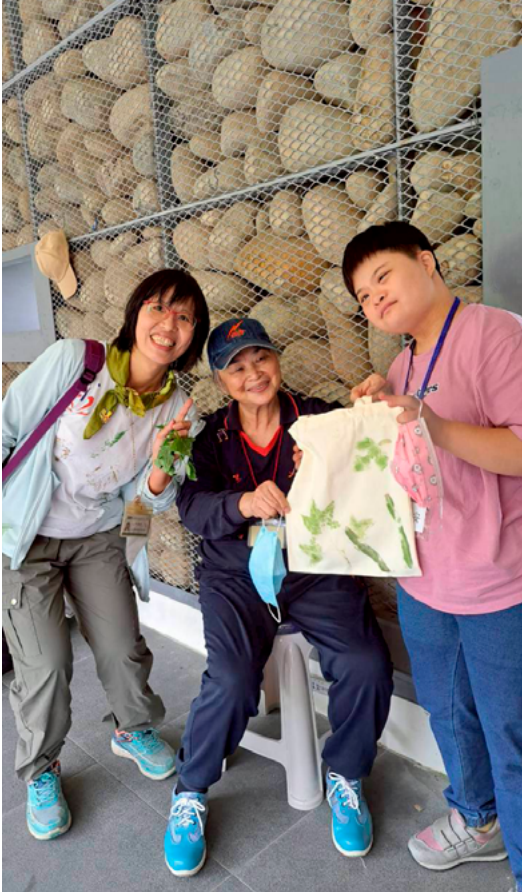
▲ 我做得也值得被看見