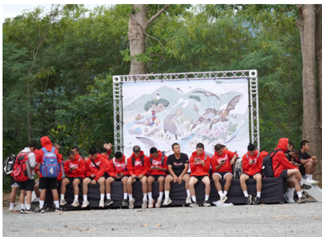
▲當地學生在主視覺前等候開跑