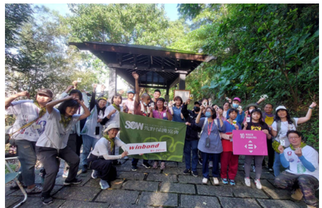
▲ 感謝華邦電子第二年經費支持身心障礙朋友走入自然