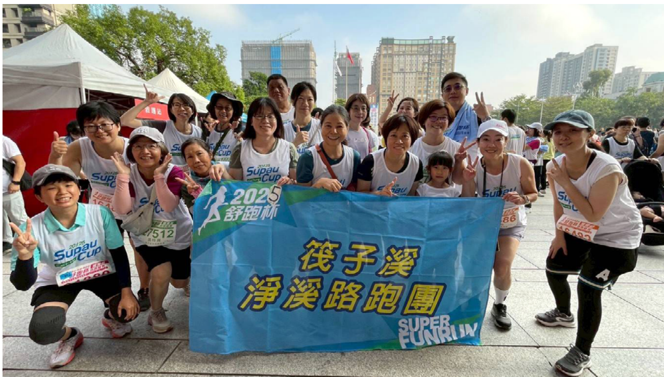
▲ 路跑結束後大合照