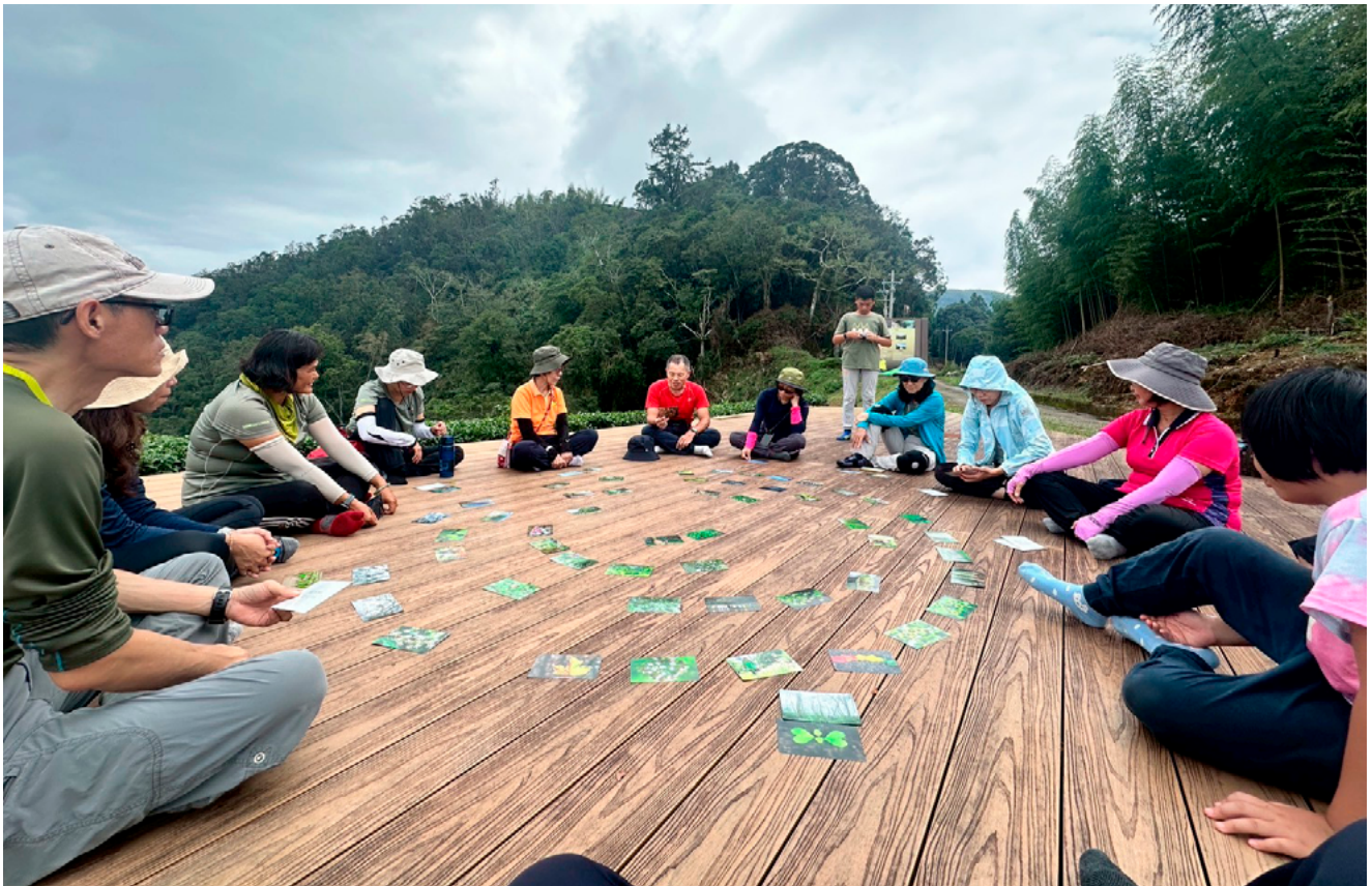
▲草嶺石壁與自然對話

在草嶺的與自然對話，新桃子讓我們在大自然中，在森林裡靜下心來，不管是躺下閉目，或是慢慢的繞圈圈，霧來霧散，時而下雨，時而出太陽，不管是什麼樣的體驗，會覺得大自然就是這樣在運行著，我們是這樣的渺小，有什麼好過