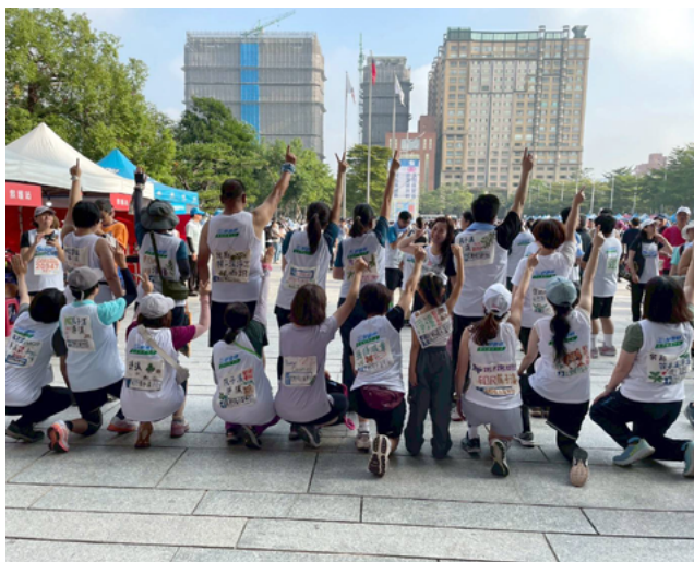
▲ 帶著守護筏子溪宣傳語而來

路跑前 2 個月，在群組裡夥伴的引導下，我們開始自訂每週計畫練跑，並回報當週是否達成目標。或許你會想說「既然自己有設定目標，跟自己設定的目標相比，有沒有在群組 PO 出自己的計畫沒差吧？」錯！差多了！在這樣的過程裡，會發現自己連訂出的每週跑量，都會想先瞧瞧是否和別人差太多，連帶也開始在意自己的跑速跟其他夥伴慢太多。覺察到這一點後，不禁噗哂一笑，趁機提醒自己應專注在跑步這件事。經