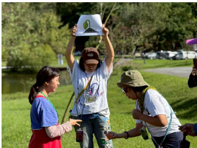
▲ 化身種子從發芽到長大

荒野保護協會的夥伴從最基本的「進山、進公園的禮儀」開始引導。那些看似簡單的提醒——保持安靜、不驚擾生物、垃圾帶走——其實正是學習尊重的起點。孩子們在接受自然教育的