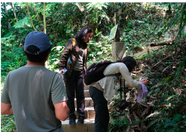
▲ 訪談與觀察導覽兼具的這天

原來「城市自然大挑戰」固定舉辦於每年 4 月的最後一週，同樣的時間中，不同地區的物候也理所當然不同，有些城市可能原本就具備得天獨厚的物種多樣性。嘉義有兩千多公尺的阿里山，涵蓋了高海拔到中海拔、低海拔的棲地環境，也有海邊、濕地等多樣的棲地類型，所以物種非常豐富。儘管苦職表示，每年的活動辦理在同個