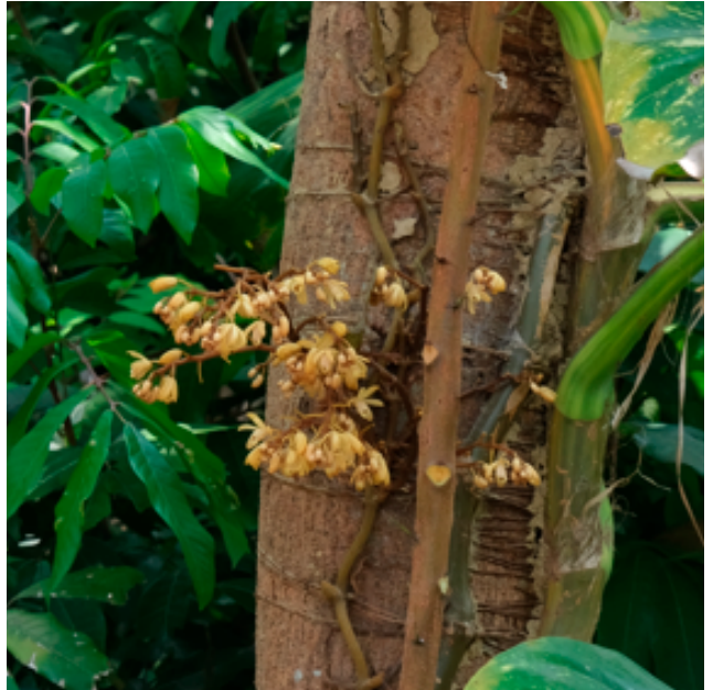
▲ 蘭潭三寶之一——蔓莖山珊瑚

在苦職分享 iNaturalist 使用的故事時，倒地鈴不時輕聲發出提醒，讓我們注意到身邊躲藏