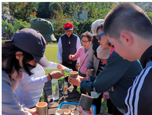
▲ 打開味覺，飲一杯氣味清香的花草茶

孩子們必須將手伸入無法透視的布袋中，僅憑觸覺找出剛剛「結交」的種子好朋友。在這場遊戲中，許多家長驚喜地發現，孩子們的觸覺敏