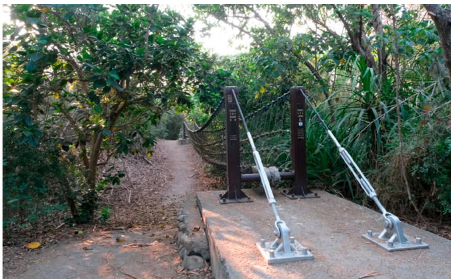
◀ 來訪二崙自然步道必看的吊橋