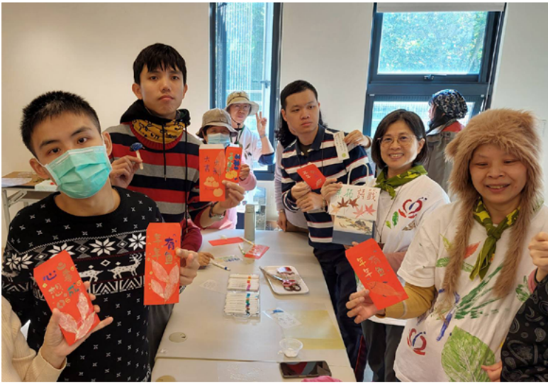
▲ 以植物紋理設計年節祝福