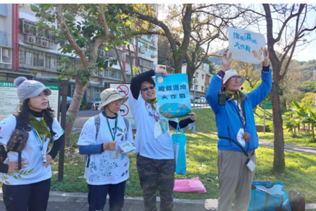
▲ 搶救濕地大作戰，人類的行為將決定濕地的命運

在歡呼與尖叫聲中，地墊忽大忽小，大人小孩都全情投入。即便是口語較少的星兒，在抽到正向卡片、聽到大人念出正向行為、領地擴大時，臉上也展露了燦爛的笑容。那一刻我們知道，守護環境的種子，有悄悄種入星兒的心中。