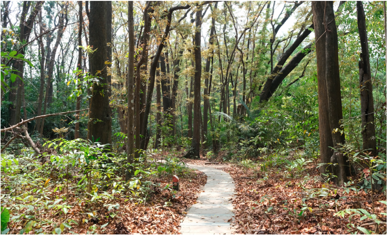
▲ 28 年前，嘉義志工許下守護之約的桃花心木林

2026「城市自然大挑戰」即將在 4/24-4/27 進行。城市自然大挑戰由美國發起，希望透過競賽的方式鼓勵大家探訪城市中的生物多樣性。除了競賽之外，荒野志工們也持續每個月在全台各地的定點使用 iNaturalist 紀錄，除了記錄下不同物種在四季的變化外，持續點亮台灣的生態地圖，因為棲地守護不只這四天，而是需要長期關注的。在這次活動前，我們訪問了同時具備荒野志工身分的兩位 iNaturalist 資深用