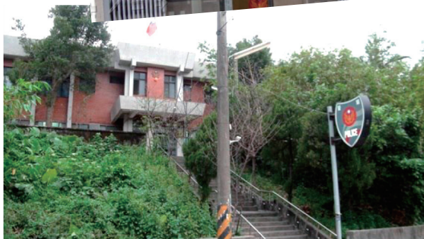
▲ 護蛙的人民保母 - 橫村派出所