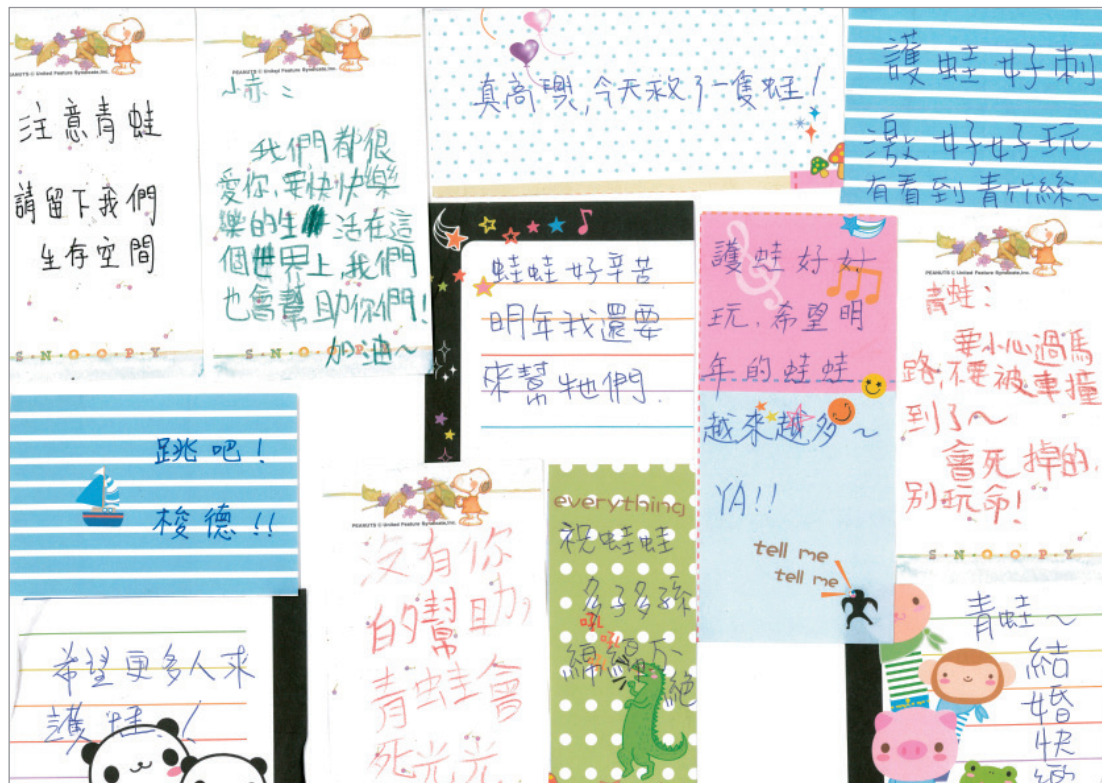
▲小朋友給青蛙的祝福