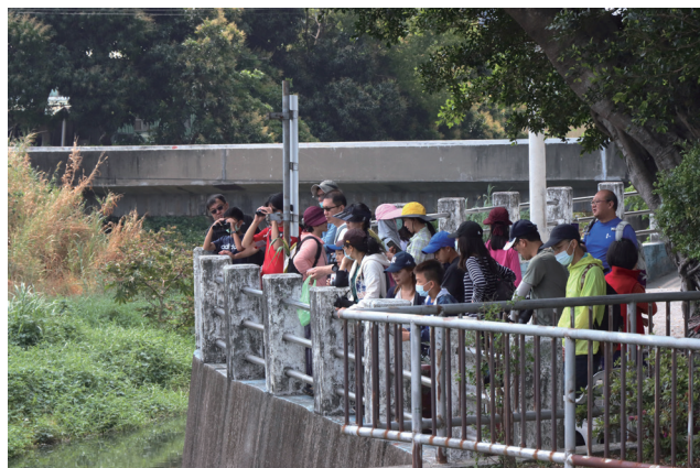
▲ 輕旅行現地認識溪流