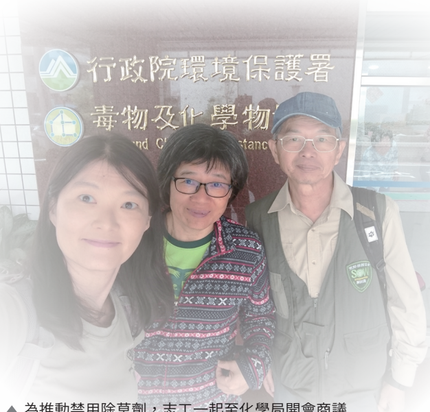
▲ 為推動禁用除草劑，志工一起至化學局開會商議

發現問題後積極向縣府反應，才得知是縣府委託鄉公所維護鄉道，但鄉公所基於人力與經費問題，部分山區較少住家的路段，會以噴灑除草劑方式定期維護。基於給梭德氏赤蛙一條安全的生殖道路，更需要給牠們一處安全無毒的棲所，鄉公所答應在護蛙區（總長約 0.8km）的路段改用割草方式處理，但其他山區路段則仍依噴灑除草劑方式辦理。