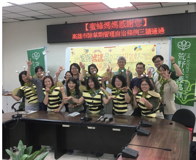
▲ 蜜蜂媽媽感謝您～攝於高雄市除草劑管理自治條例三讀通過 自 2018 年起連（2018～2021 年）環保署化學局委請荒野保護協會協助進行「非農地禁用除草劑」的宣導。