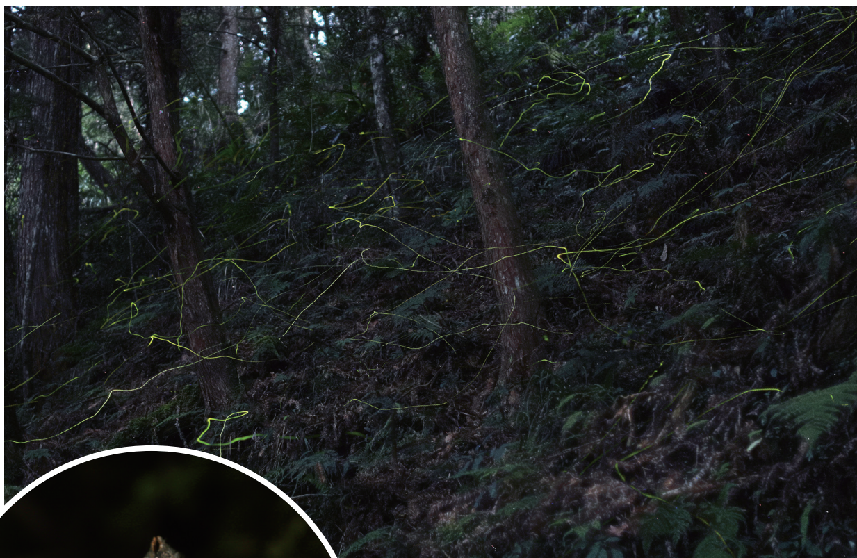
▲ 冬季的神木螢 - 持續光