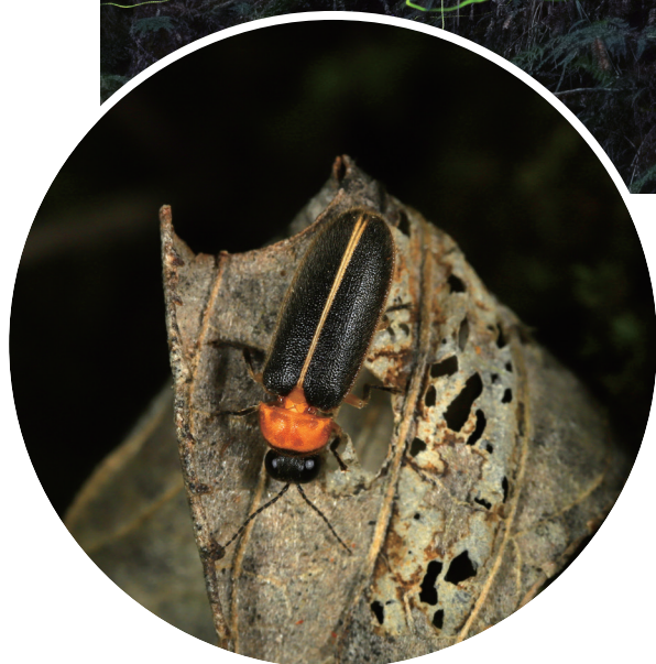
▲ 水生螢火蟲 - 黃緣螢

灣絕大部分都是陸生螢火蟲，水生螢火蟲僅有黃緣螢 ( Aquatia ficta )、黃胸黑翅螢 ( Aquatia hydrophila ) 及條背螢 ( Sclerotia substriata ) 等 3 種，因此顯得相當的珍貴。這些水棲的幼蟲主要捕食淡水的螺類、貝類及蝸類，待準備化蛹時，會爬上岸邊濕潤的土壤中化蛹，最後羽化為成蟲，並於天空中自由自在的飛行，所以水生螢火蟲成蟲不會在飛回去水裡。