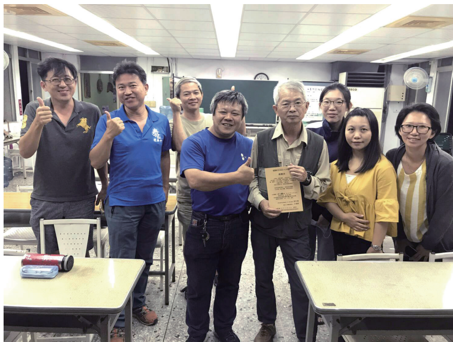
▲ 2018 年於各地推廣非農地禁用除草劑講座

面對環境問題就是這樣，沒有辦法一次達標，只要能往前挪一小步，大家一起持續努力，就會慢慢接近理想目標。為了讓「大家持續努力」，就得邀集大家一起面對這個議題，所以