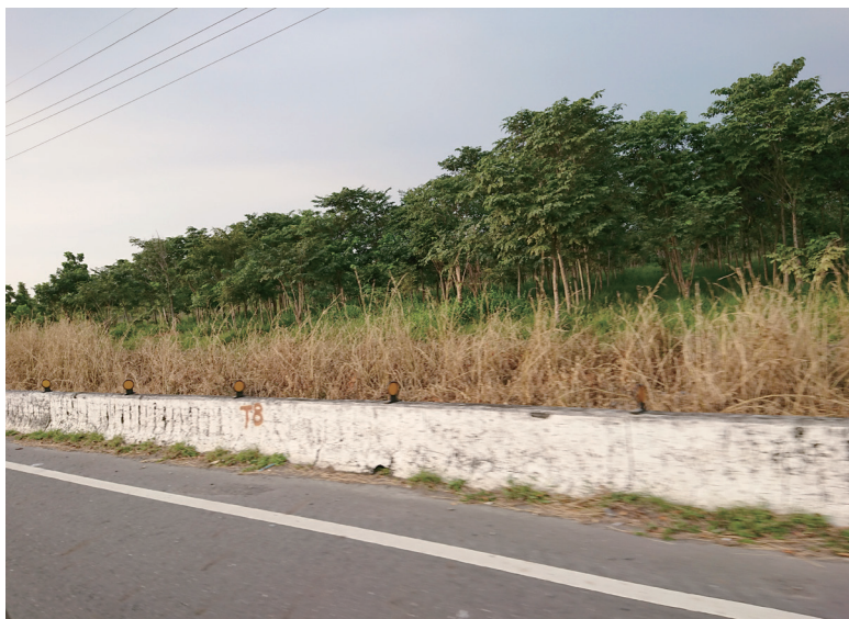
▲ 為禁用除草劑舉辦志工們自發性到鄉道調查

為什麼護蛙行動與禁用除草劑相關呢？這要回到 2009 年起，每年 10 月份協會在新竹縣大山背舉辦「幫青蛙過馬路」活動，期望給梭德氏赤蛙一條安全的生殖道路。當時有生態專家建議爭取設立「生態廊道」，為使廊道設置範圍，能被更多生物能利用，先展開「路殺動物調查」。