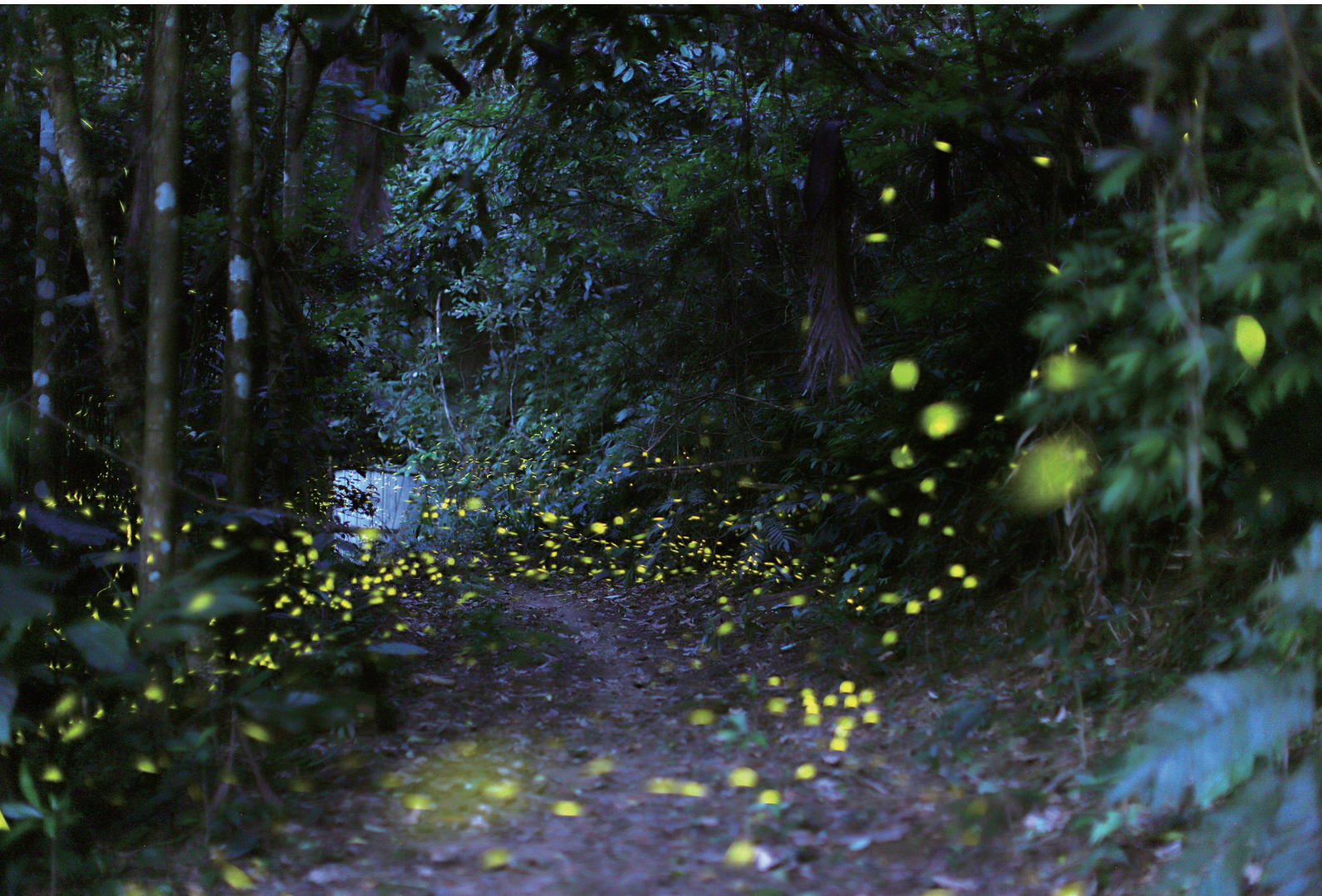
▲ 春季的黑翅螢 - 閃爍光