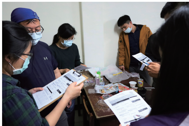
▲ ICC 表格練習