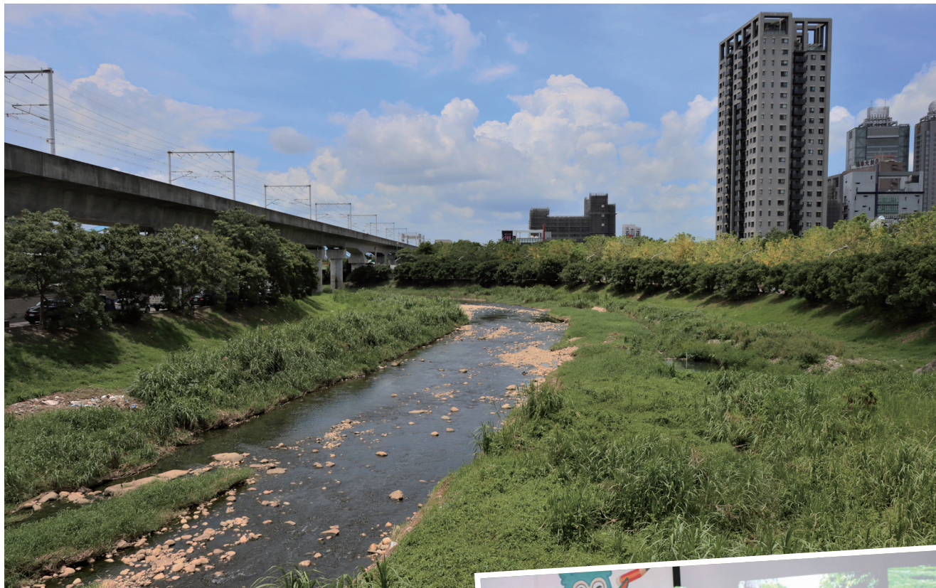
▲ 2021.06.18 筏子溪中游