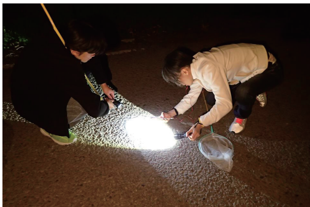
▲夜晚大山背總有許多驚奇

幫青蛙過馬路活動是一場「愛的接力」，這不是一晚，也不是一整個十月，而是365天的行動。護蛙行動所做的一切就是我們對自然之愛的延續，幫青蛙過馬路也是一堂「生命教育」，