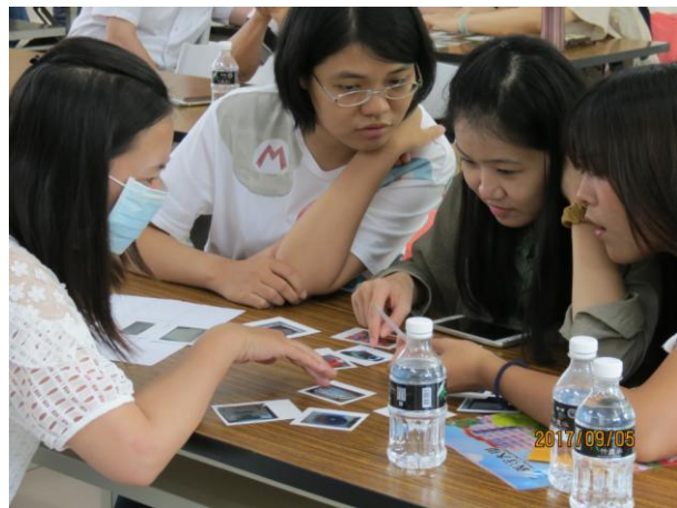
電器耗電量比一比