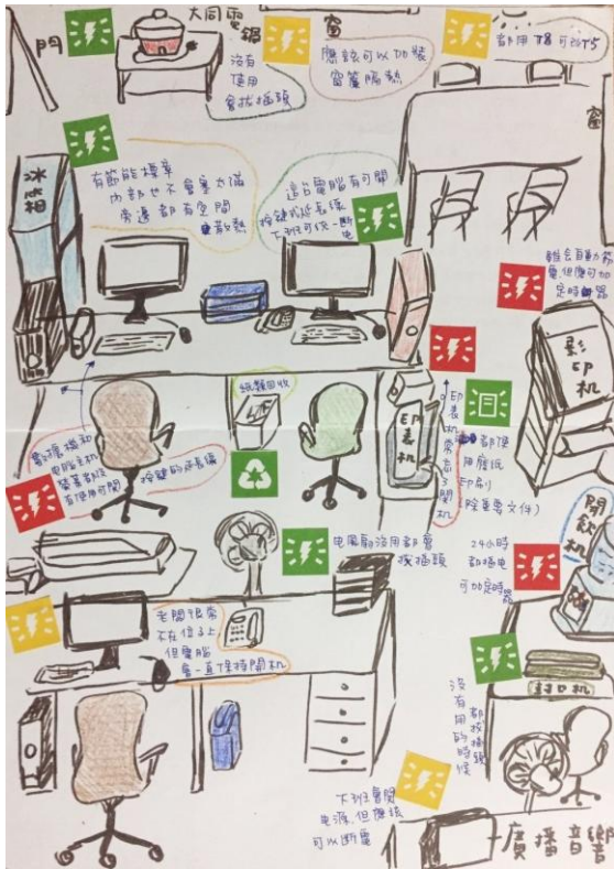
辦公室節能綠活圖