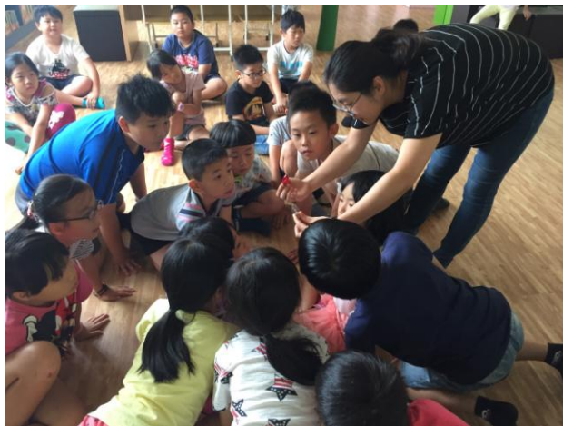
比較傳統神明燈與 LED 神明燈