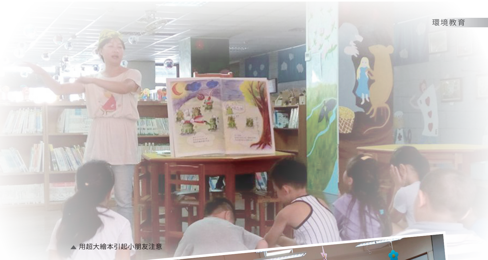
▲ 用超大繪本引起小朋友注意