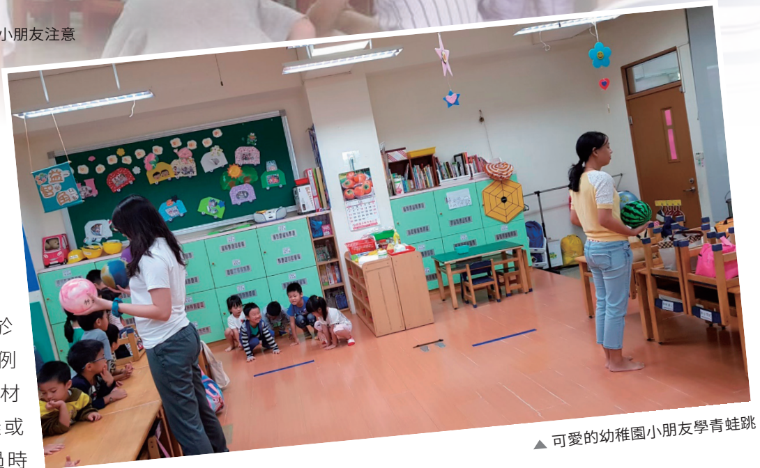
▲ 可愛的幼稚園小朋友學青蛙跳

的前輩們傾囊相授關於護蛙時遇到的種種，例如護欄高度與青蛙身材比例、小小隻的青蛙或其他動物被輪子輾過時的慘樣…有了這些更貼近真實情況的背景資料，再加上繪本推廣講師的經驗分享，我們便自己揣摩、研究，面對各種不同年齡層觀眾，講題內容要如何調整，分享方式也必須更多元。