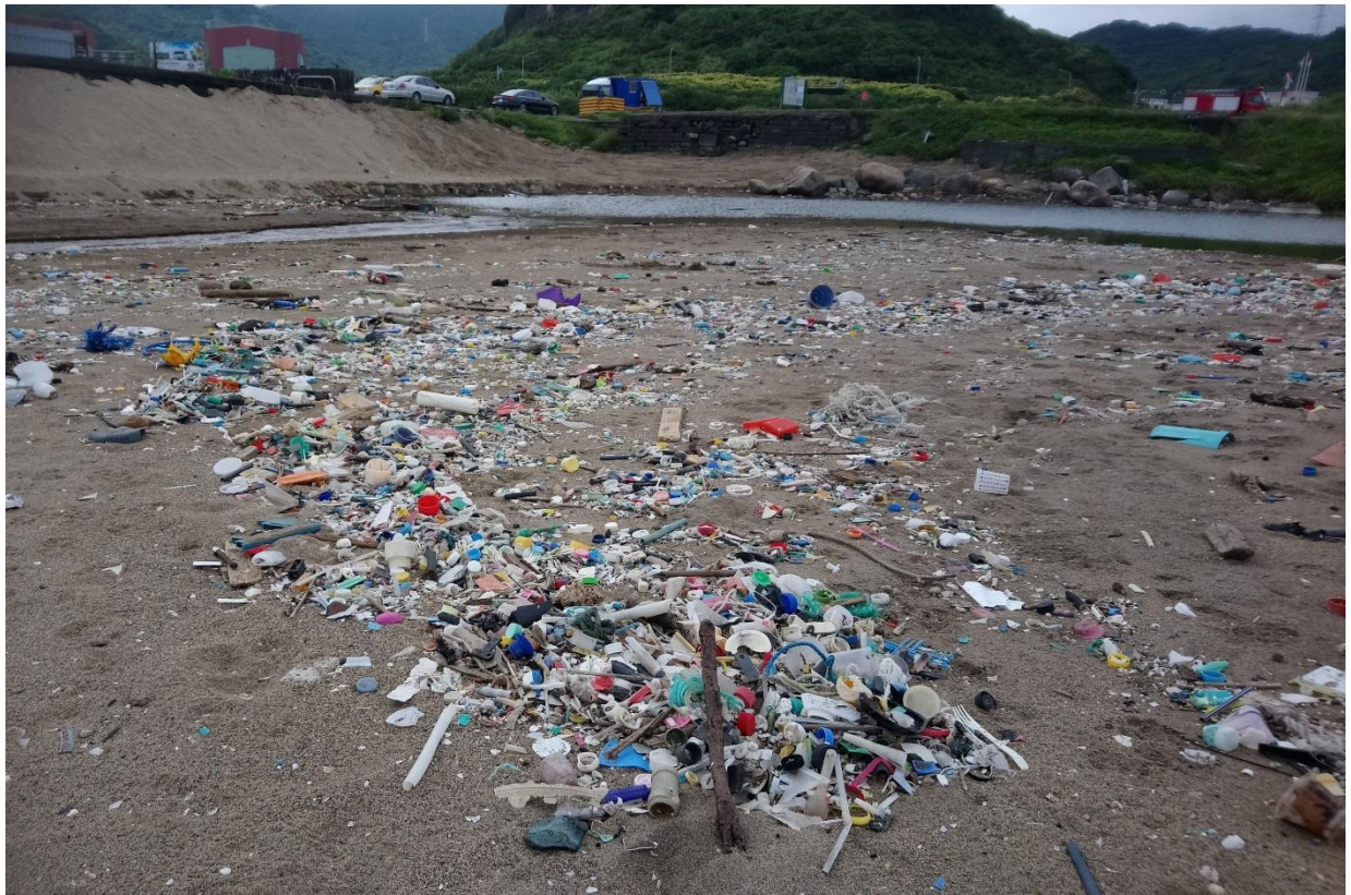
06 寶特瓶與塑膠瓶蓋仍占據 2020 年海廢數量的前兩名