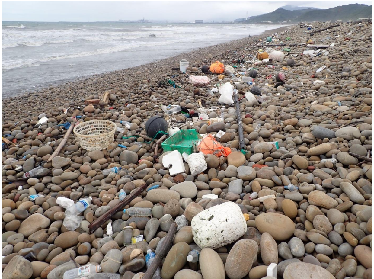
05 撿拾到的海廢有九成以上為塑膠材質