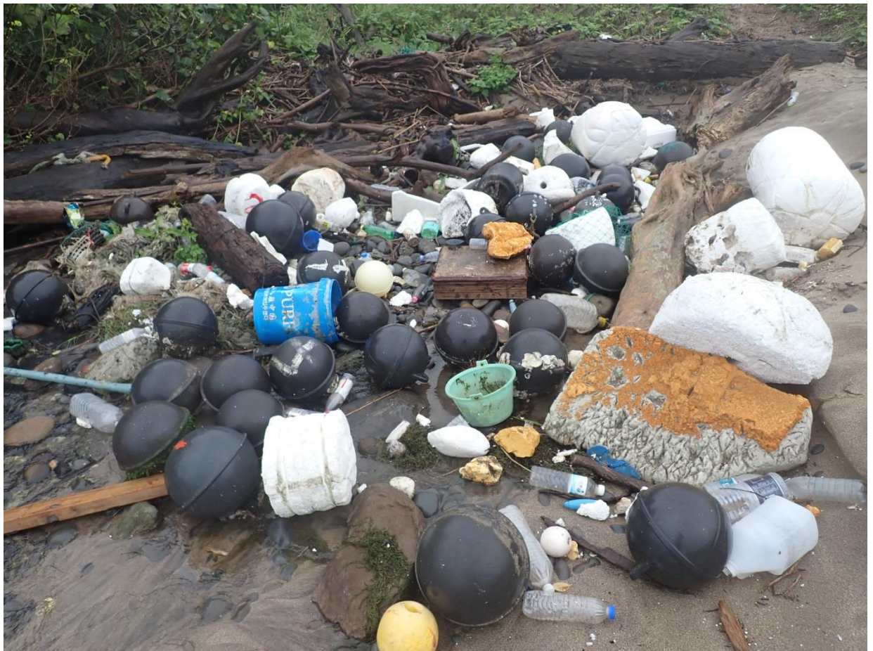
04 漁業相關廢棄物仍是淨灘常見的海廢之一