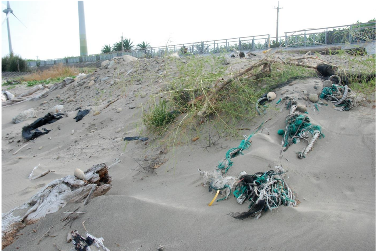
03 漁網魚繩普遍因為被掩埋在沙灘中而難以清除