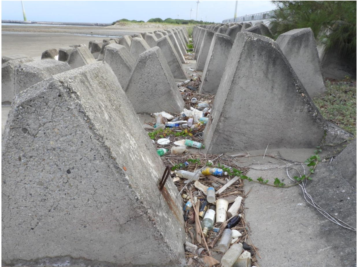
07 消波塊空隙時常會堆積許多海廢