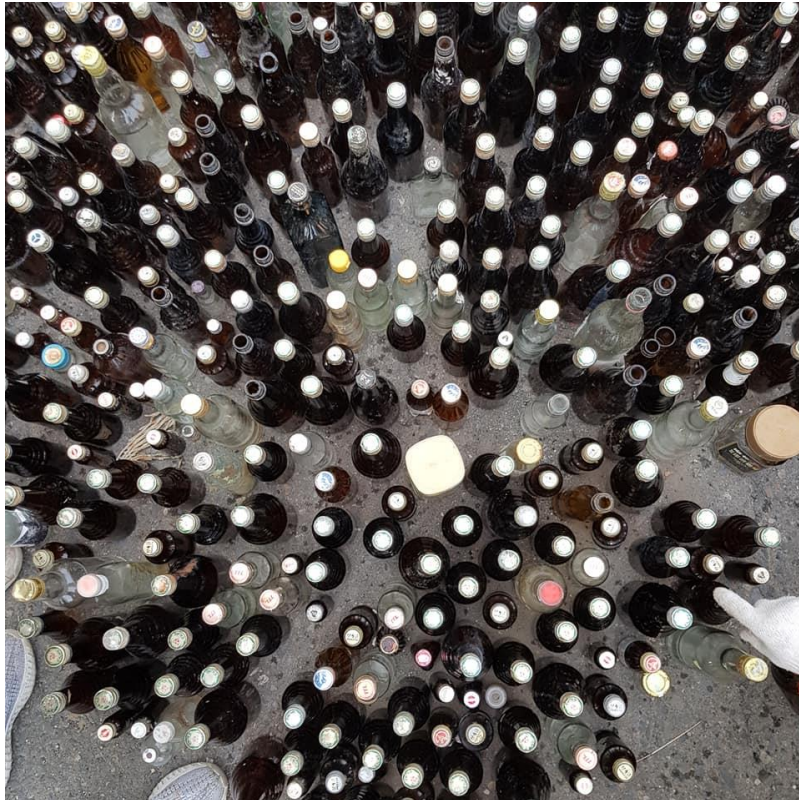
01 單場次的淨灘活動就撿拾到大量玻璃瓶